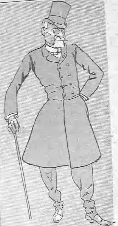
—Todavía, todavía se pirran por este cuerpecito, que fué la pesadilla de la corte de Carlos IV.