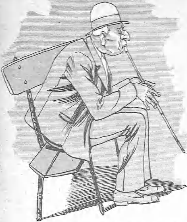
—Los fondos de la cofradía que se han de invertir en misas podía yo gastármelos en una buena merienda con la mujer del sacristán; de todos modos, cosa de iglesia es.