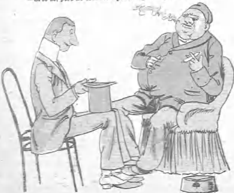
—Para mantener á mi hija, ¿con qué cuenta usted? —Pues yo generalmente cuento con los dedos. Es la mejor manera de no equivocarse.