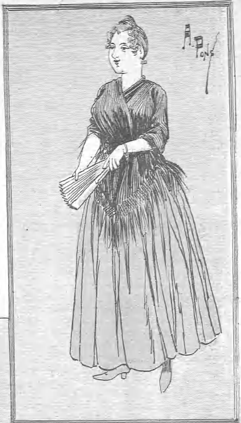
—Esta noche voy yo á la verbena pá que se convenga la Morros que lo que á mí me sobra son hombres pá hacer un rosario como dende la Frábica hasta Chamberí. ¡Es un digamos!