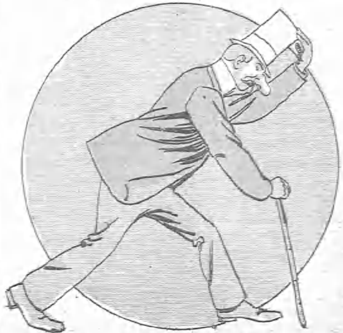
—(Lo que es la falta de costumbre! A cada paso que doy me parece que se me va á caer.