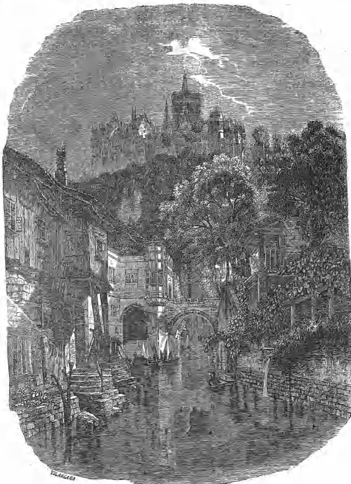
VISTA DE MEISSEN.

Todos los viajeros están de acuerdo en el encanto particular que el agua comunica á los paisajes; sin ella falta al efecto general esa vaga harmonía que sirve para enlazar los detalles por medio de una serie de degradaciones y reflejos. El agua es como un segundo cielo, que reproduce abajo una parte del efecto de las medias tintas y de los perfiles que se destacan en lo alto sobre el otro cielo. Con razon se ha llamado «la gracia de la naturaleza» á ese cristal que bulle, se agita y reproduce todas las imágenes, haciendo alarde de gozar de mas vida que el resto