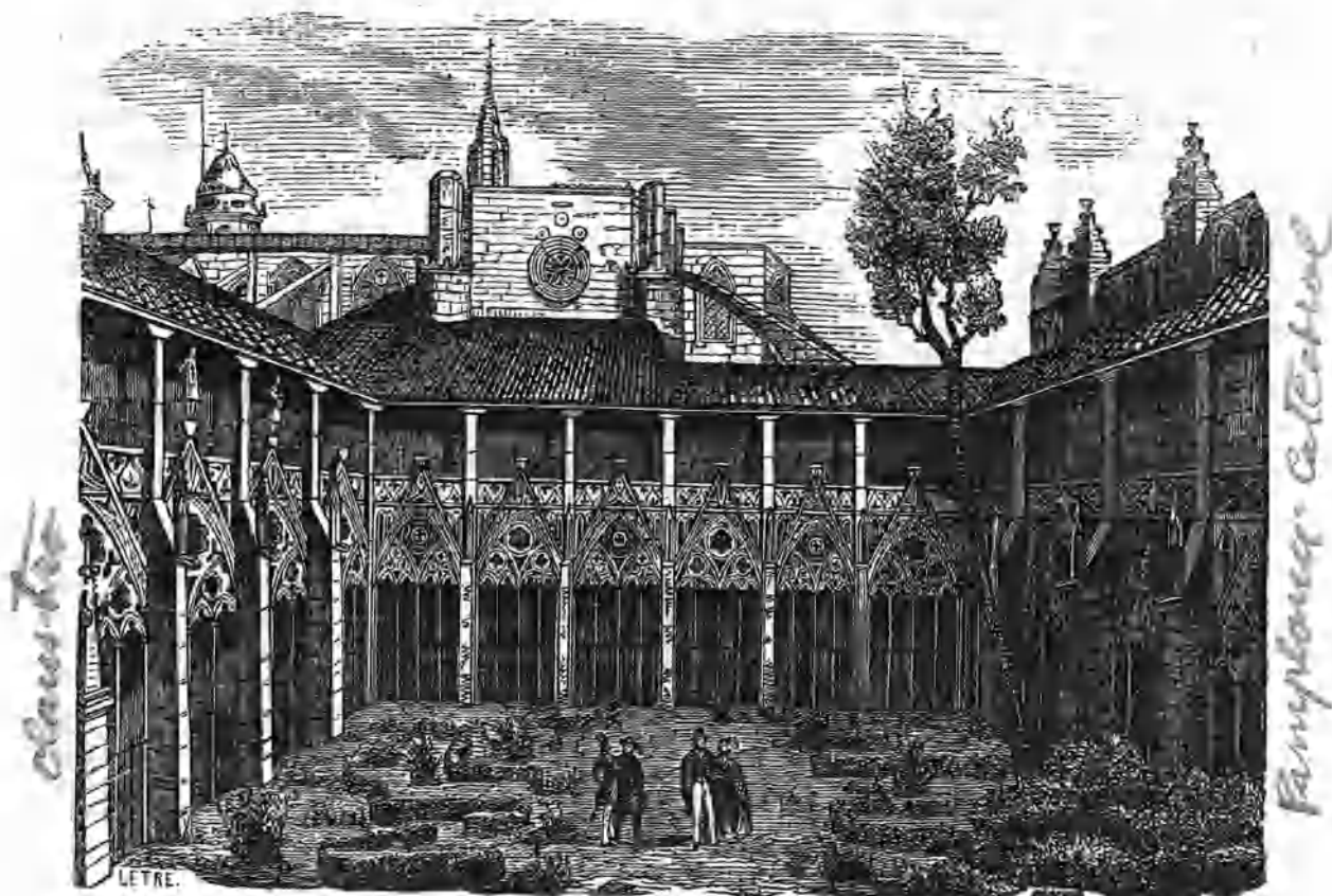
Vista del claustro.