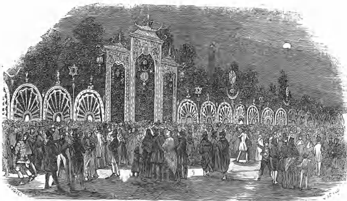
Vista de la Iluminación del Prado.

Descripción de las fiestas reales celebradas en Madrid en octubre de 1846, con motivo del casamiento de S. M. la Reina Doña Isabel II y de la Serma. Sra. Infanta Doña Luisa Fernanda.