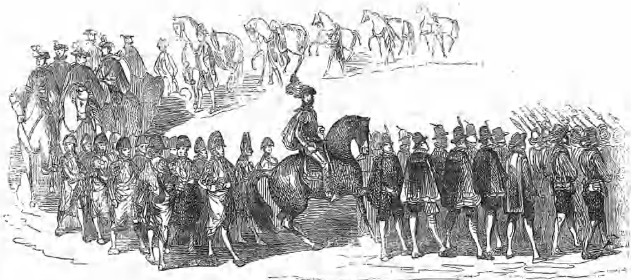
Comitiva de un caballero en plaza.

Experimentóse alguna dilación en los preparativos de la fiesta que indudablemente seria precisa; mas de un