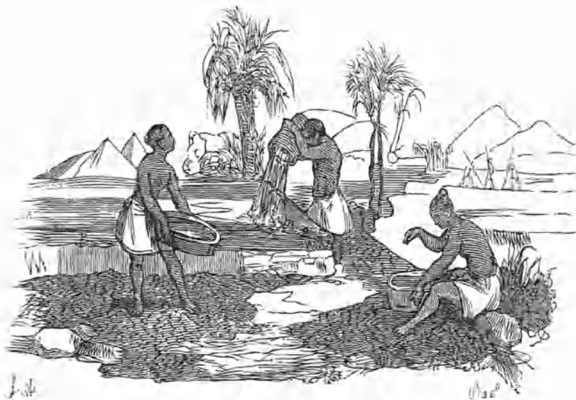
Negros labando los diamantes.