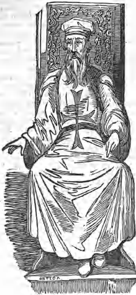
(Gran maestre de la orden de Malta.)