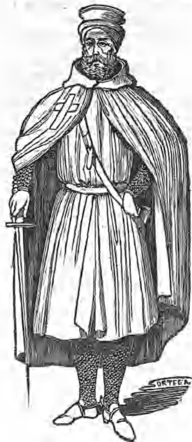
(Templario en traje de guerra.)