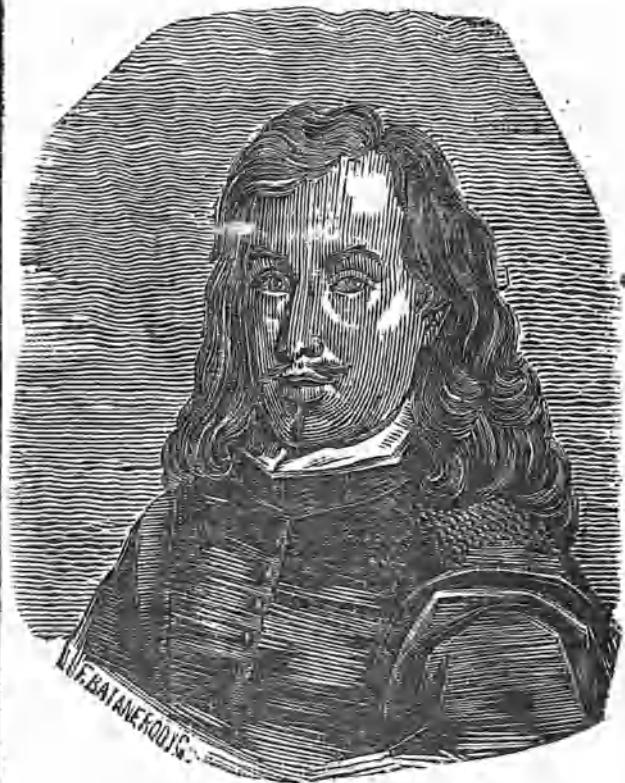
Retrato de Murillo.