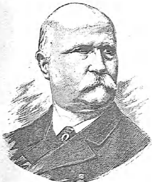
D. MANUEL DEL PALACIO