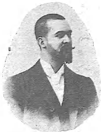
Fundador de LA GRAN VÍA