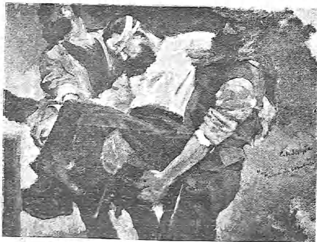
FUERA DE COMBATE.—BOCETO DE UN CUADRO DE COTANDA