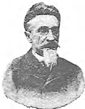
D. JOSÉ MARÍA DE PEREDA