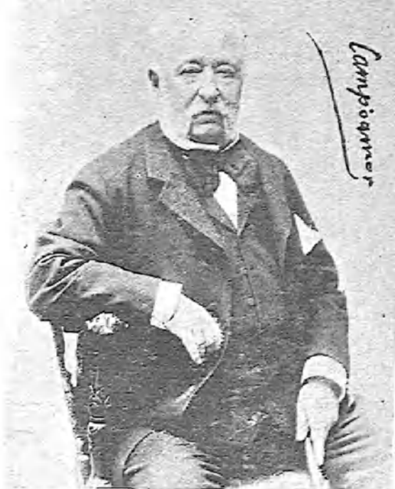
D. RAMÓN DE CAMPOAMOR

Para mi ilustre amigo y compañero el Sr. D. Salvador Rueda