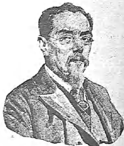
D. MANUEL TAMAYO Y BAUS