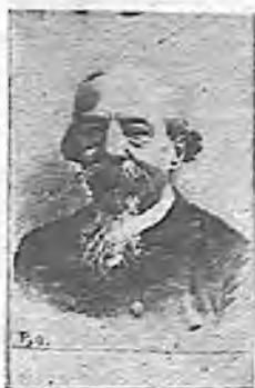
D. JOSÉ ZORRILLA