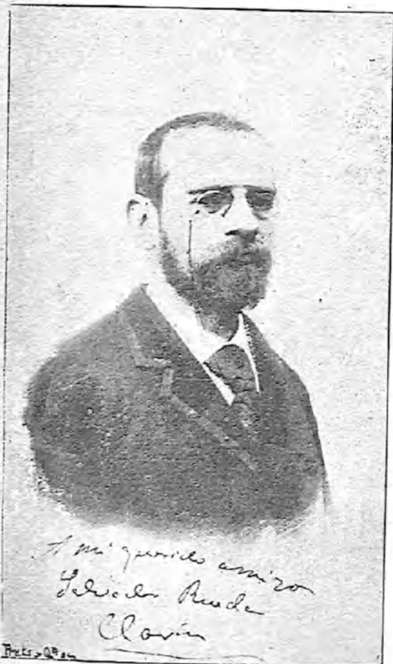
D. LEOPOLDO ALAS

Para mi ilustre amigo y compañero el Sr. D. Salvador Rueda