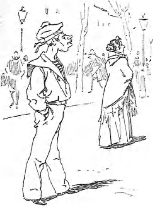
Buque á la vista.