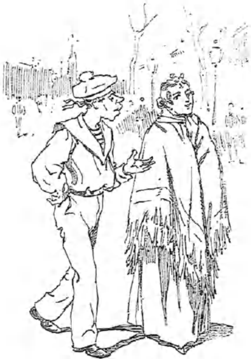
Ponerse al habla.