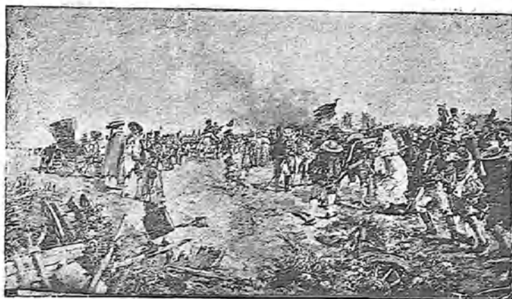
LA DEFENSA DE CÁDIZ, POR F. MOTA