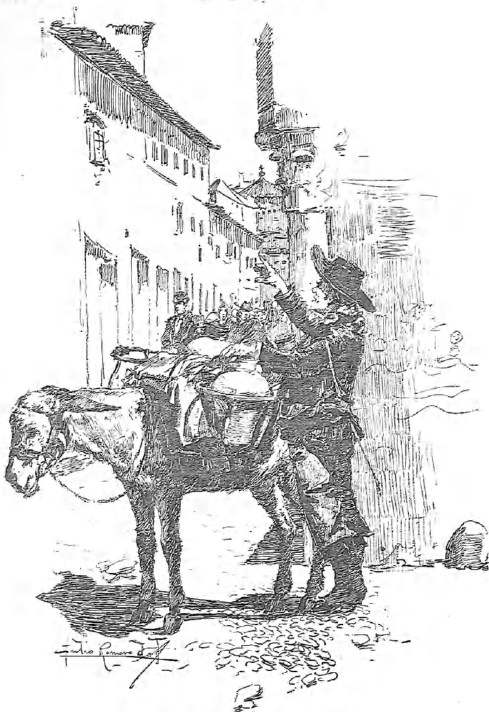
DIBUJO DE JULIO ROMERO DE TORRES