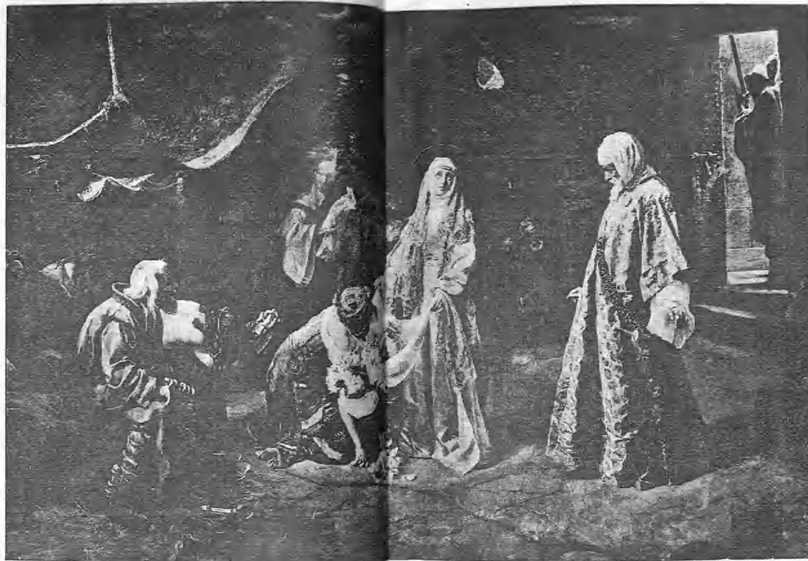
EL MILAGRO DE SANTA CASILDA, POR NOGALES