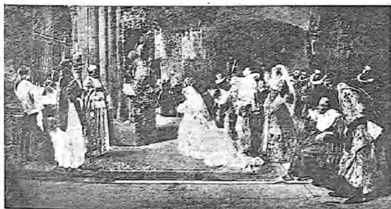
ANTES DE DAR EL SÍ, POR JOSÉ URÍA