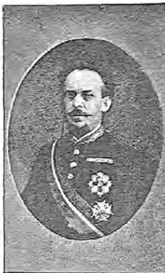
D. MANUEL PAVÍA Y RODRÍGUEZ DE ALBURQUERQUE

Las pacificaciones de Cartagena, Córdoba, Sanlúcar de Barrameda y Sevilla; su intervención en la guerra del Norte; todos los méritos, en fin, que menciona su hoja de servicios, significaban nada para sus conciudadanos: el general que naciera en la esplendente Cádiz, era para los españoles una fecha: por eso le denominaban El hombre del 3 de Enero . Con andaluza sangre en las venas, genio aventurero y un corazón muy español en el pecho, de haber nacido en pasados siglos. Hernán Cortés ó Pizarro lo hubieran tenido á su lado en sus atrevidas empresas; como no ocurrió así, tuvo que acometerlas en el enturbiaido ambiente de nuestras revoluciones.