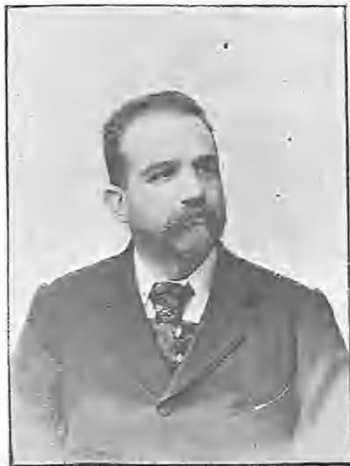
D. Emilio Serrano, autor de la ópera Gonzálo de Córdoba .