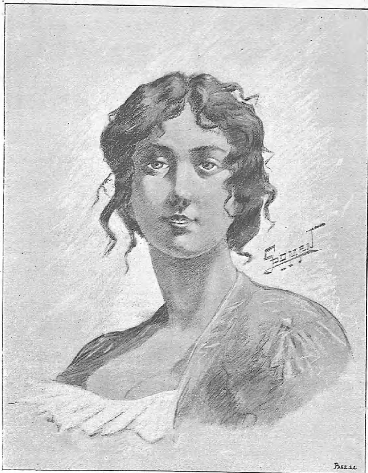
Cabeza de estudio