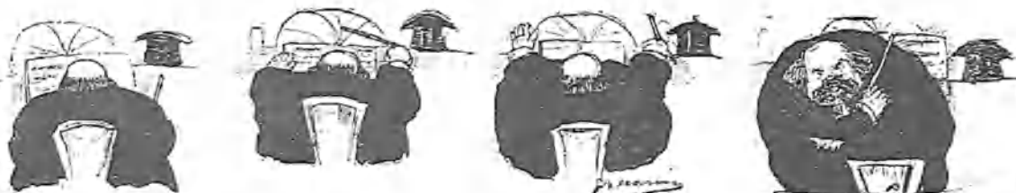
El maestro Caballero.