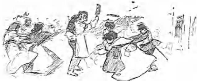
Escenas de Gigantes y cabezudos.

tristezas que alegrías al corazón; porque la herida está reciente y reciente la afrenta y aquella jota llorosa de los repatriados no produce la dulce emoción de lo artístico, sino amarga sensación de lo que aun se padece. Acaso por esto, la nueva zarzuela de Miguel Echegaray y de Caballero, no ha tenido un buen éxito indiscutible ante el público del estreno. Pero como las facilidades de las funciones por horas, las permiten envejecer en los carteles y el buen pueblo español tiene tan buena encarnadura para cicatri-