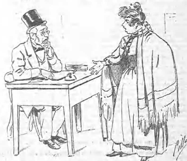
Y, por último, que no sabe cómo no leé hizo daño la mezcla.»