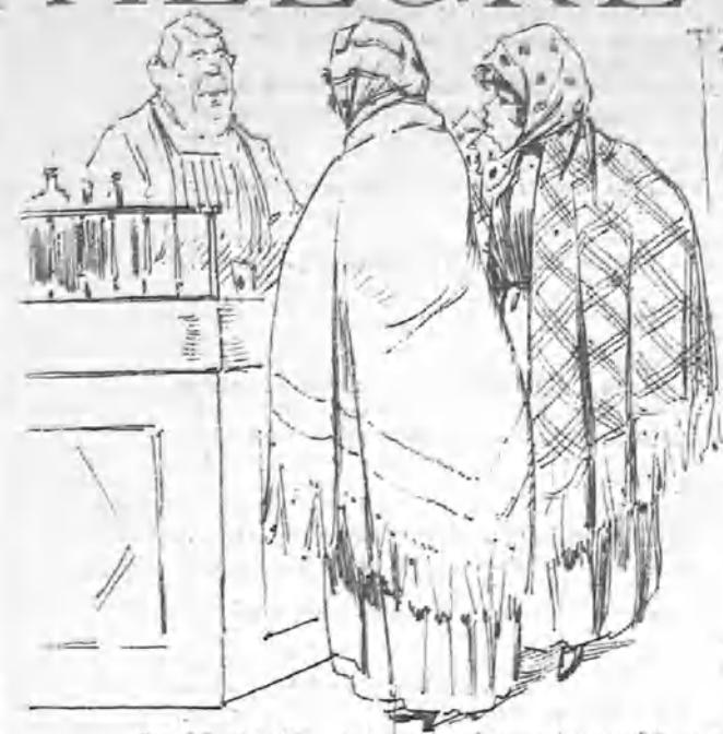
Que en seguida, según costumbre, entraron á tomar unas copitas en la calle de San Bernardo.