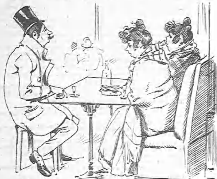
El cual, á sus instancias, las convidó á moscatel con bizcochos en el café del Mundo Ilustrado.