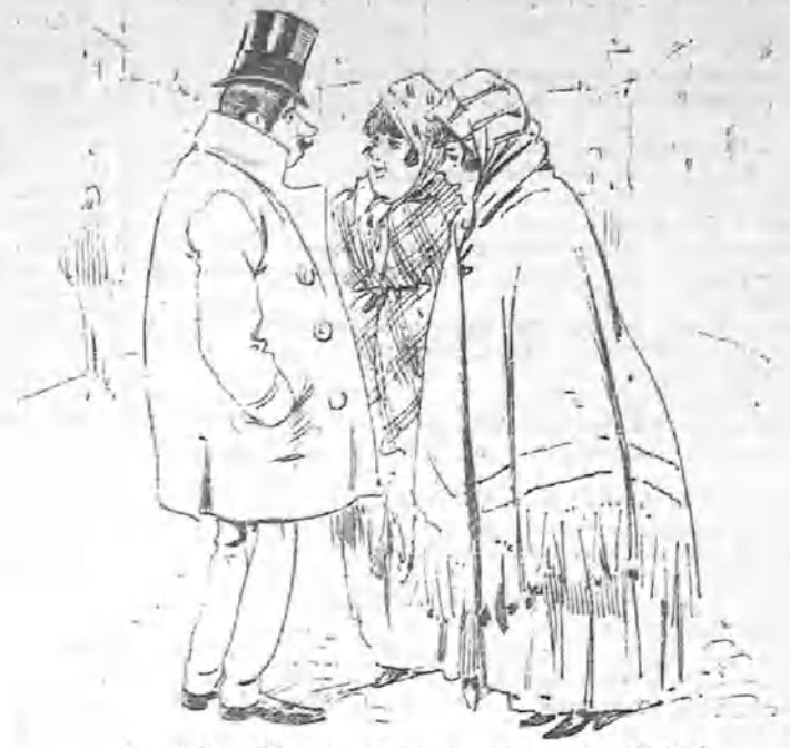
Que á la salida se encontraron con un chico de la grandeza amigo de ambas.