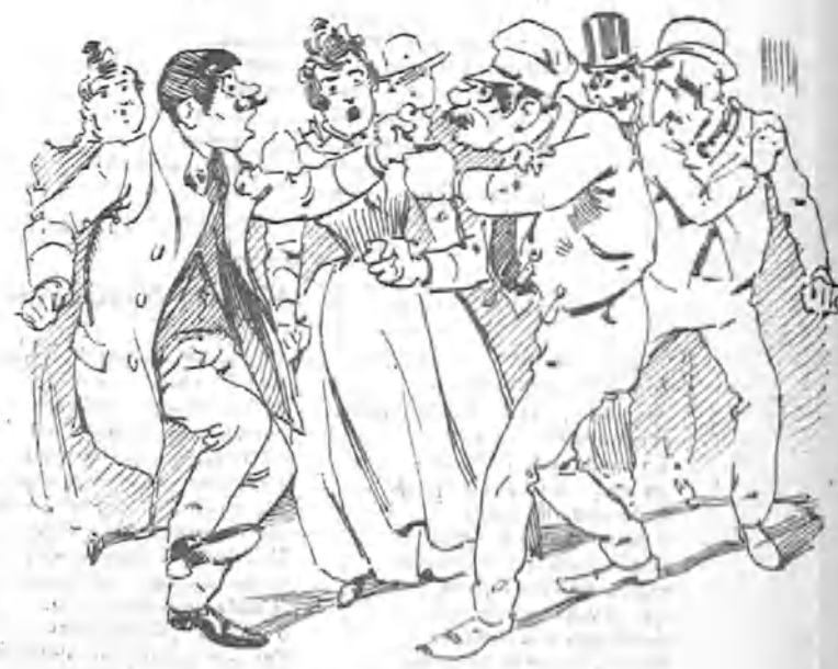
Que se volvieron á liar con un cabayero que se pasó con la declarante.