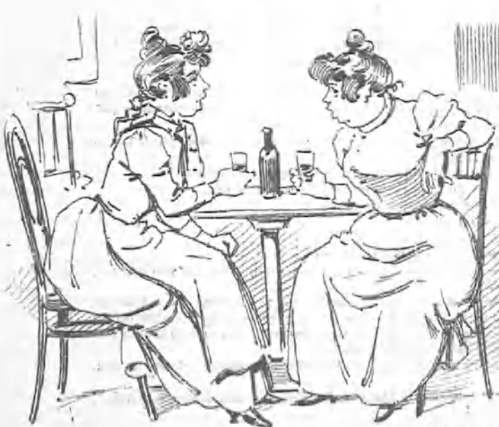
Que se retiraron solas á su domicilio y se acostaron después de tomar unos chupitos de aguardiente.