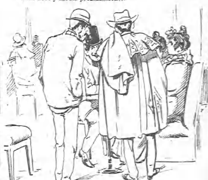
Donde se aproximaron otros amigos.