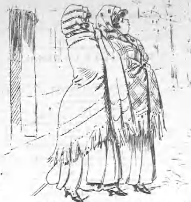
Que salió del colegio con su compañera la Frescota, á las doce y media próximamente.