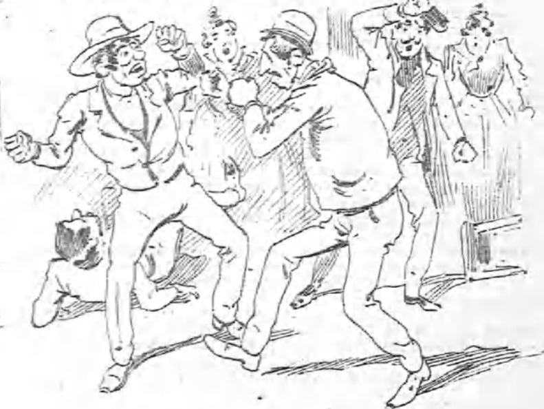
Y allí se dieron de morradas con un antiguo conocido.