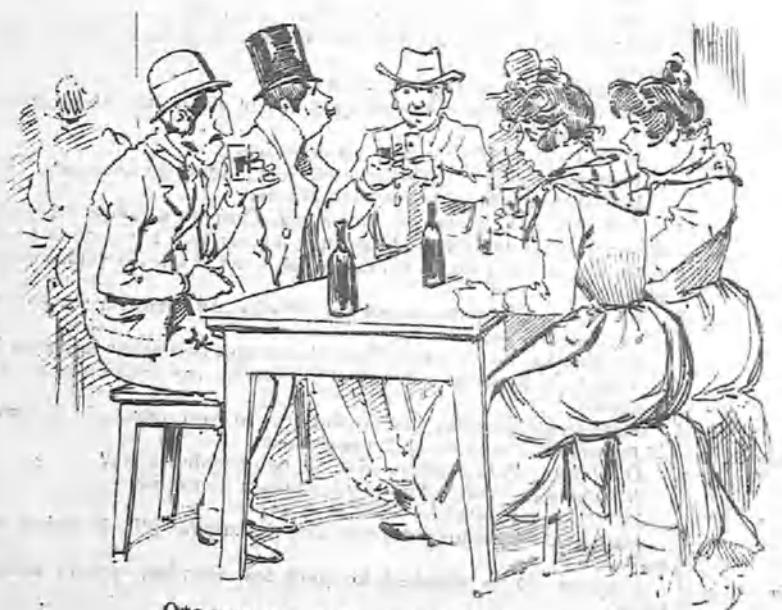
Que para hacer las paces bebieron un par de botellas en la tienda de Rufina la Pamplí.