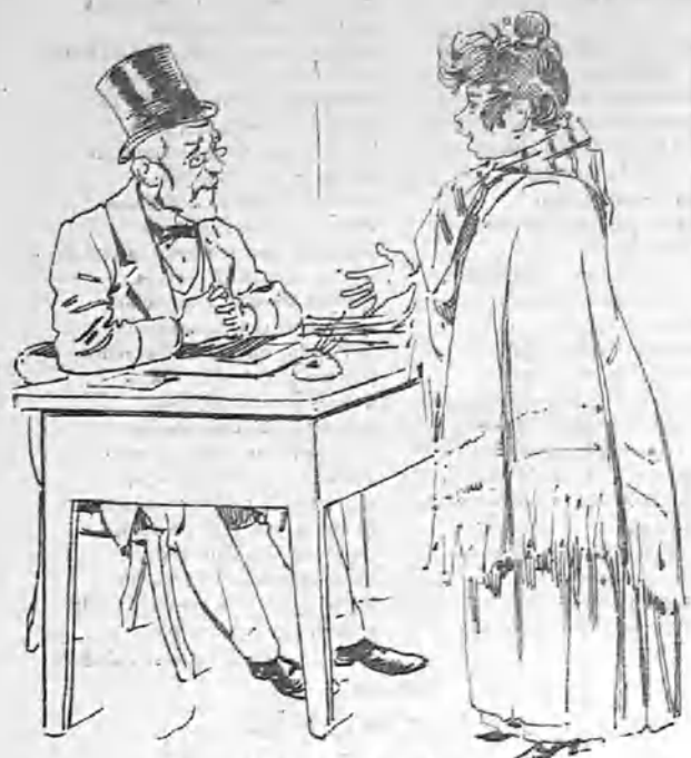
«Compareció Luisa la Desvergosa y dijo: