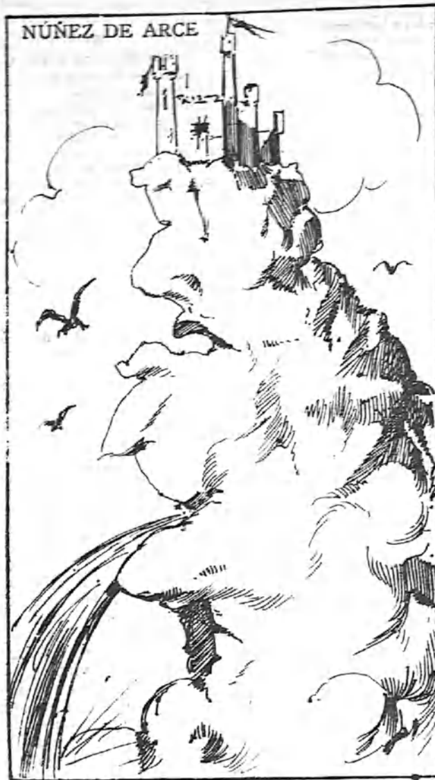
NÚÑEZ DE ARCE

Y si en la quebrantada el viento zumba; al romperse en el muro del castillo parece que penetra en una tumba.