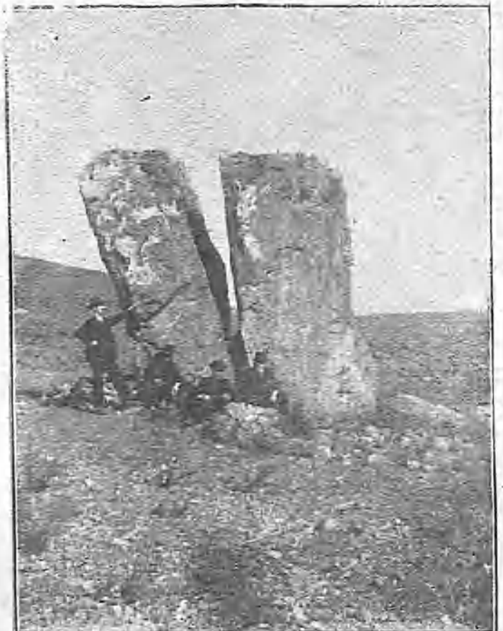
MENHIR DE LA PEÑA RUBIA