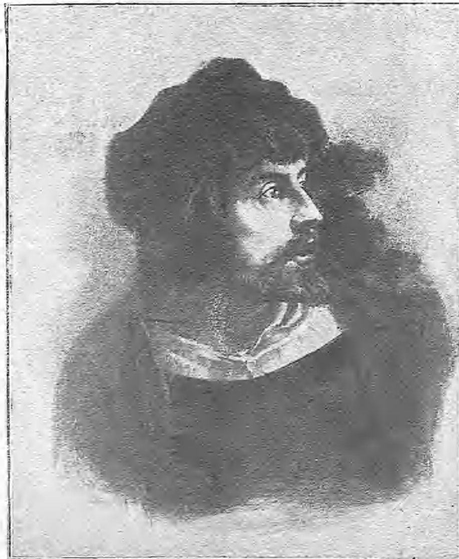
MR. MOUNET-SULLY, EN «HAMLET»