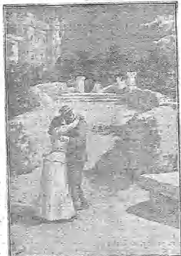
CONSEJO DE EL LA PROMESA DE QUE YA NO INTENTARÍA VOLVER A VERME

«A más de lo que me hace recordar la memoria, guardo una fotografía suya, que hice sacar sin que nadie lo supiera