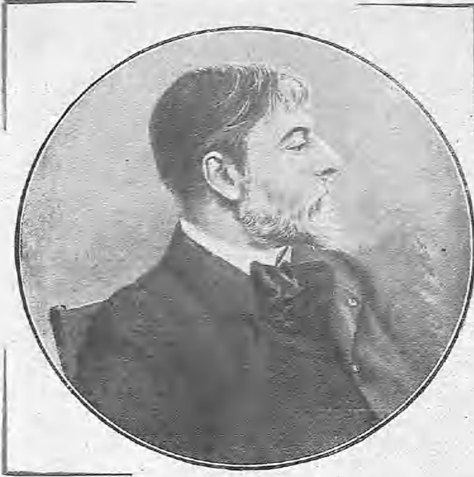
EL INSIGNE ACTOR DE LA COMEDIA FRANCESA, MR. MOUNET-SULLY