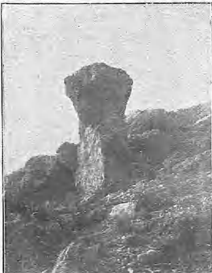
PIEDRA DEL CROMHAH DE LA PEÑA RUBIA