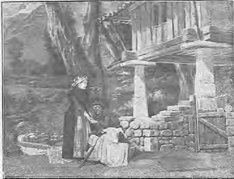
UNA ESCENA DEL SEGUNDO ACTO DE «LA NENA»