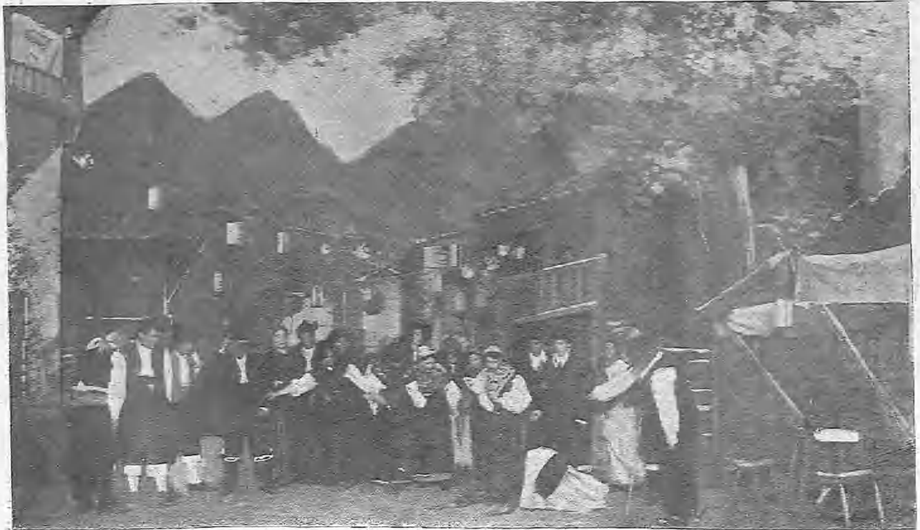
UNA ESCENA DEL TERCER ACTO DE LA NUEVA OBRA DE D. FEDERICO OLIVER, «LA NEÑA»