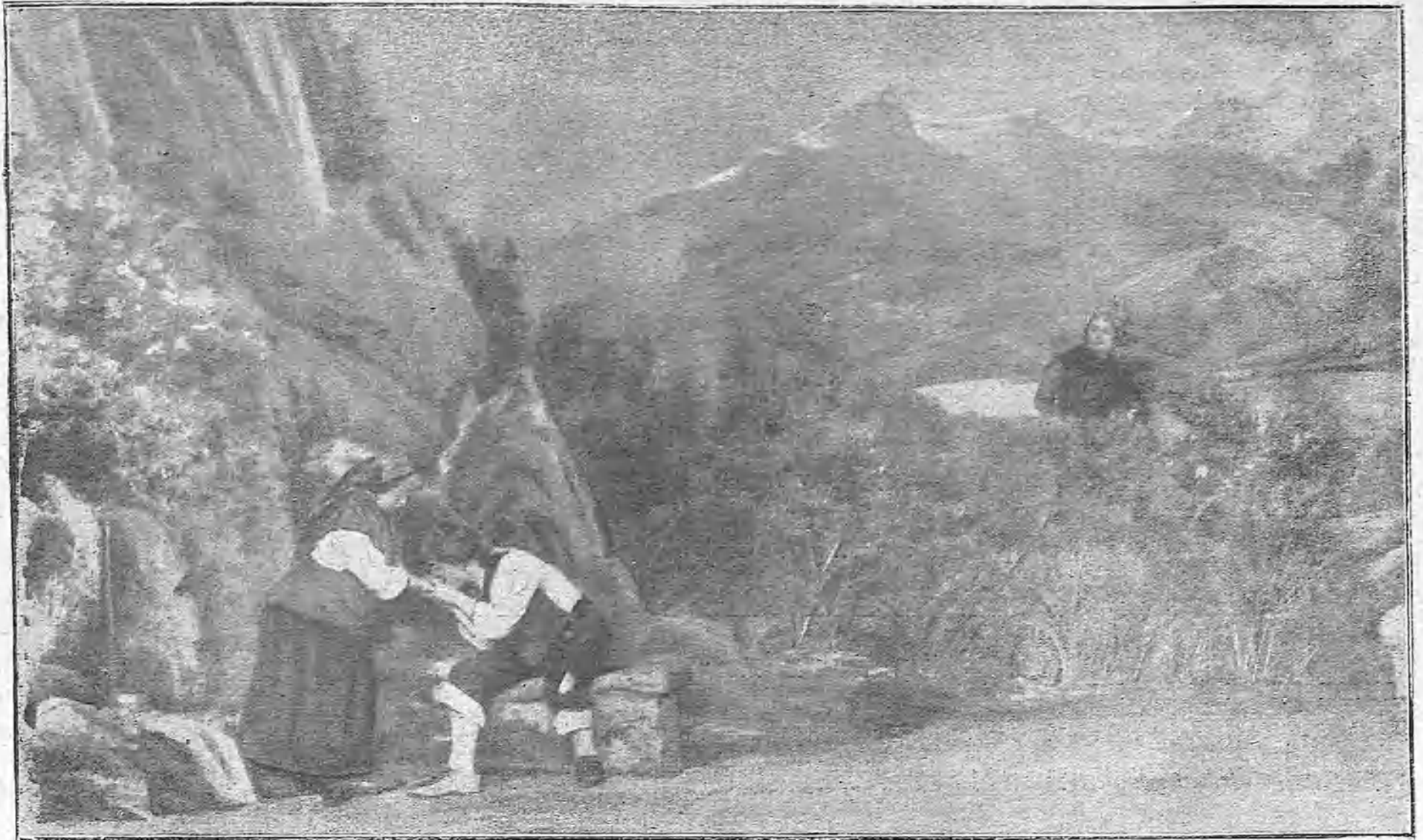
UNA ESCENA DEL SEGUNDO ACTO DE «LA NEÑA»

guerra indefinida? Es absolutamente necesario encontrar el medio de hacer frente al enemigo durante el tiempo que él quiera, sin demostrar fatiga ni cansancio. Aquí debo hacer una confesión leal. Al principio de nuestras victorias el entusiasmo popular rayaba en locura; cada uno temía ser el último en felicitar á nuestros valientes soldados. Hoy la fiebre ha disminuído; el pueblo permanece indiferente. ¿Cómo interpretar esta postración? No le