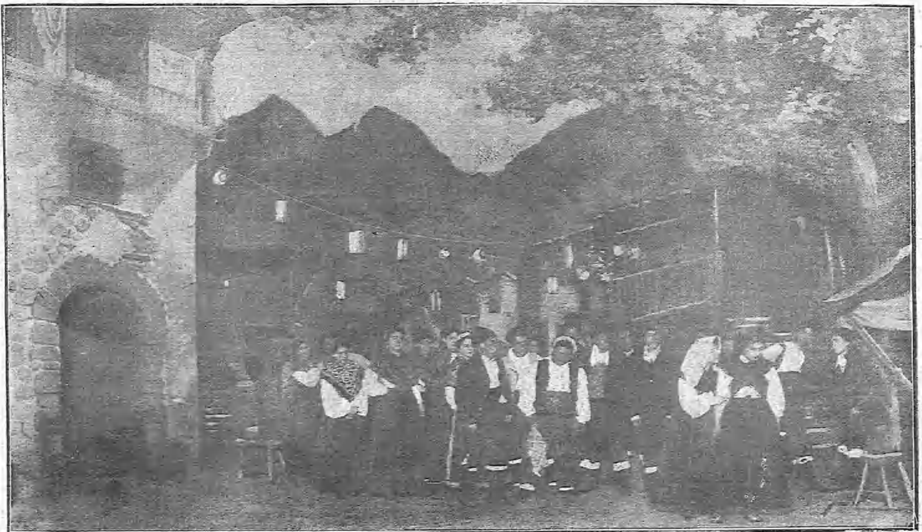
UNA ESCENA DEL TERCER ACTO DE «LA NEÑA»

des, un medio que nos permita hacer frente y esperar indefinidamente á un enemigo que no depona las armas. No nos conviene de ningún modo que el campo de operaciones se extienda; tampoco deseamos la cesión de una gran extensión de territorio. Después de una de esas victorias que aplastan al enemigo, habrá que elegir algunos puntos principales de fácil defensa contra adversarios que no han sabido conservarlos. Esta