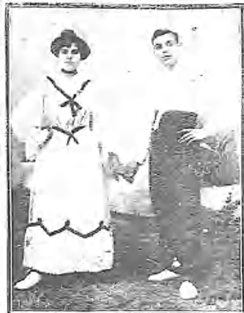
PAREJA DE BAILE FORMADA POR LOS HERMANOS ARAMAYO

Este magnífico mosaico será trasladado al Museo Imperial de Constantinopla.