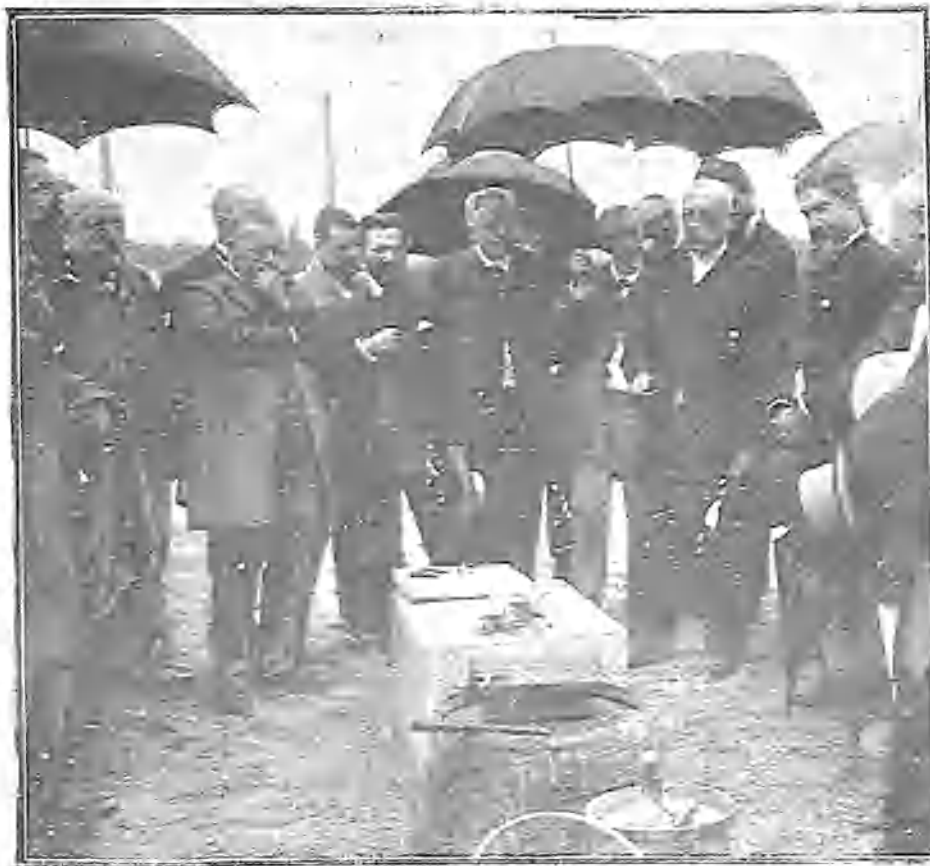
ÚLTIMO DISCURSO DE WALDECK-ROUSSEAU CON MOTIVO DE LA COLOCACION DE LA PRIMERA PIEDRA DEL ASILO DE ARTISTAS DRAMÁTICOS DE POST-AUX-DAMES

Es evidente que estos medios adoptados para la limpieza y la higiene son mejores que los que pueda costearse individualmente cualquier carnicero.