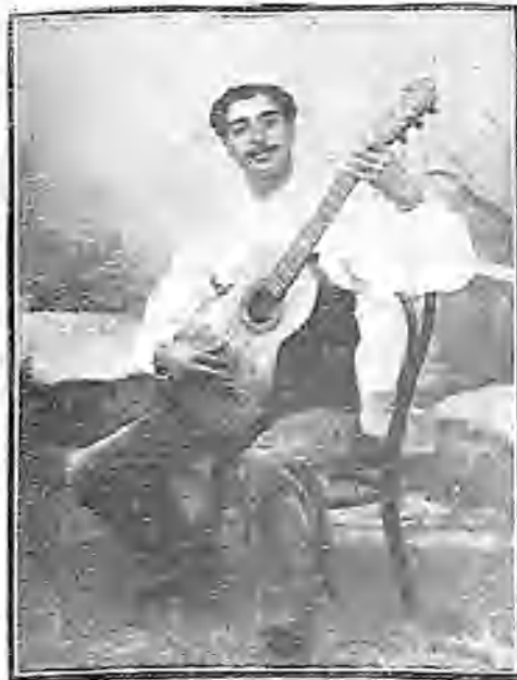
EL CANTADOR JOSÉ LASANTA (a) RINCONERO