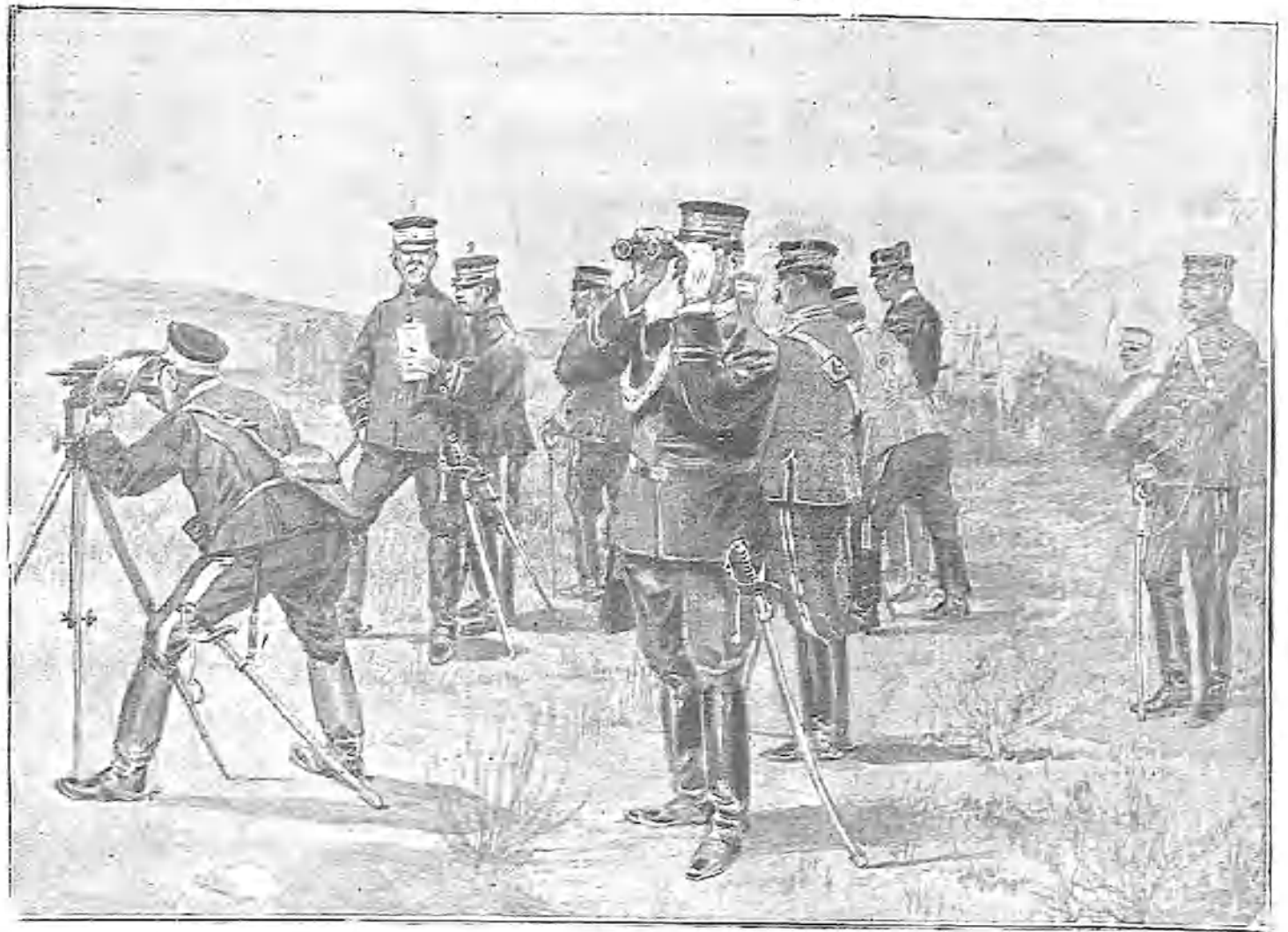
EL GENERAL JAPONÉS KUROKI, CON SU ESTADO MAYOR, EN EL CAMPO DE OPERACIONES. 1. GENERAL KUROKI.—2. AYUDANTE DEL GENERAL