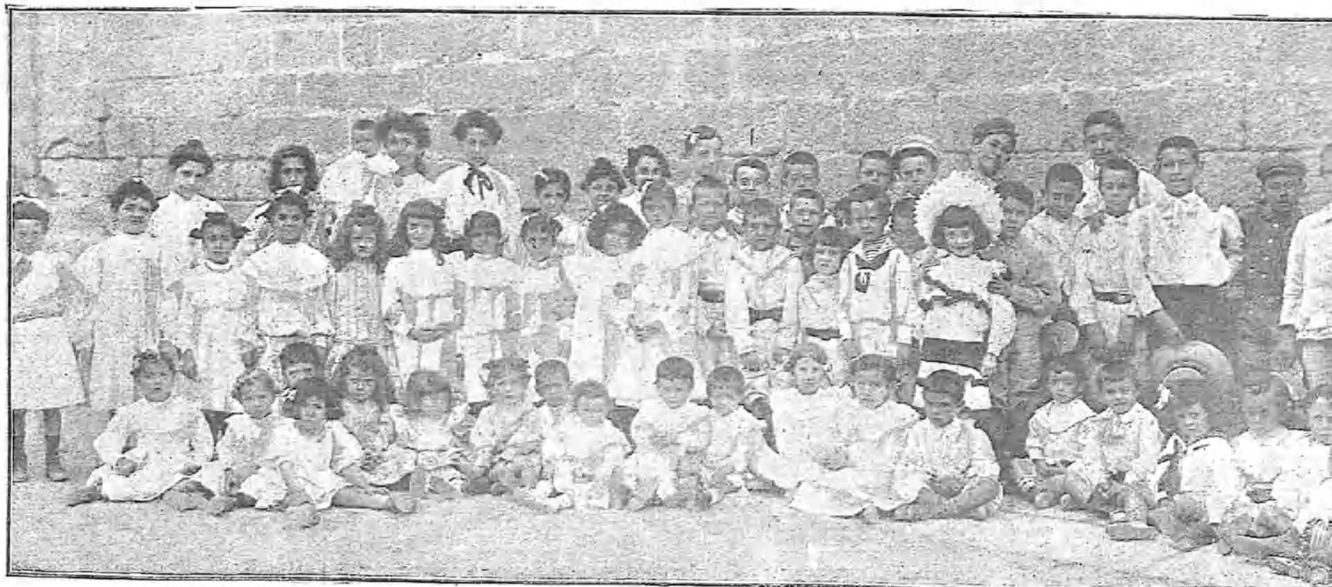
NO SE ACABA EL MUNDO.—LA COLONIA INFANTIL, QUE FORMAN LOS NIÑOS DE LAS FAMILIAS VERANERAS

Pronto ha de inaugurarse, y es innegable la importancia que tiene para los intereses españoles la idea.