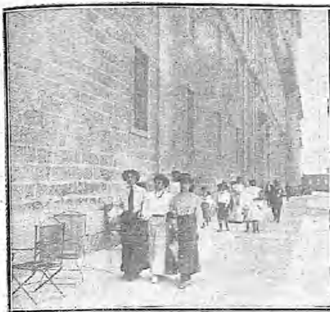
DE PASEO POR LA LONJA