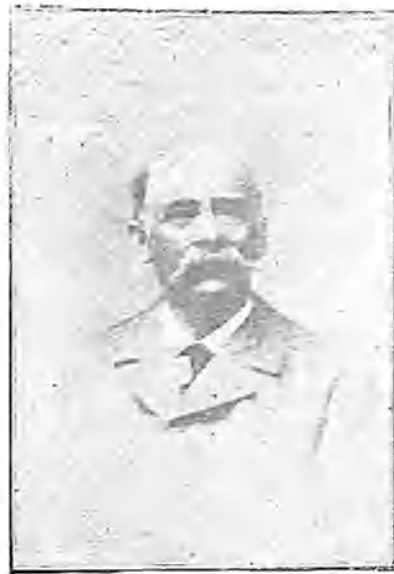
D. NICOLÁS SERRANO, ALCALDE DE EL ESCORIAL