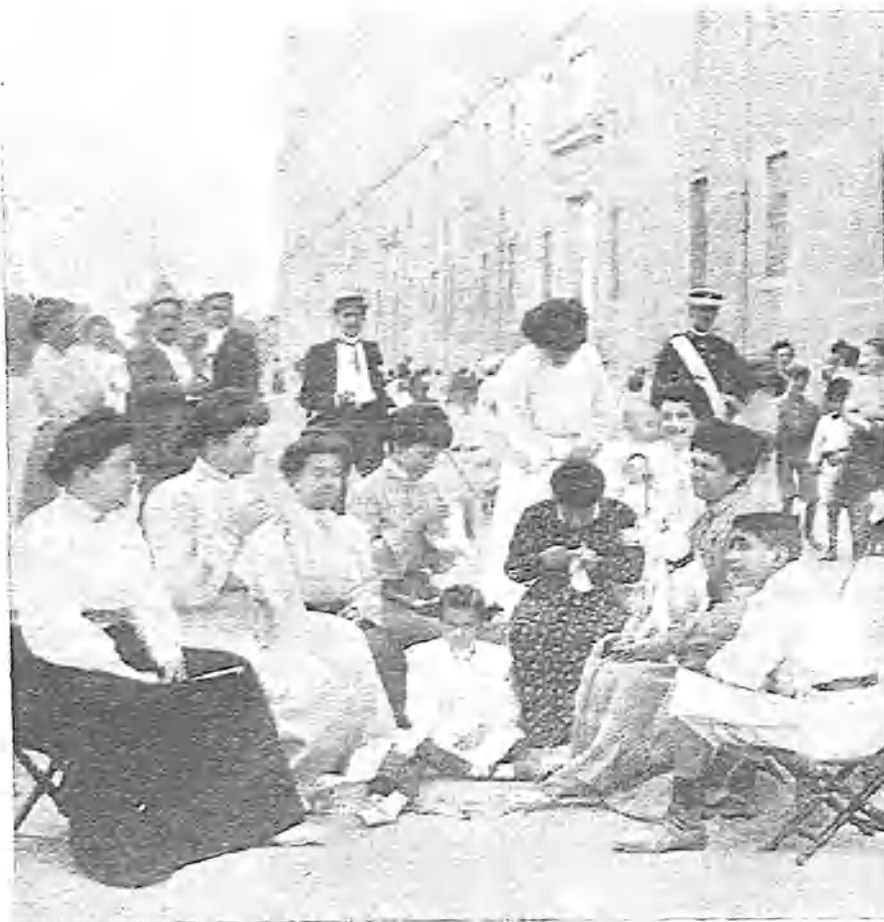
LAS MAÑANAS EN LA LONJA

Poco tiempo después, puede decirse que se interrumpe la vida en El Escorial. Nadie sale de casa; la siesta brinda con sus dulzuras. De seis a ocho se ve muy concurrido el Paseo de los Pinos, pasando la gente a orillas del estanque de la Casita de Arriba, refrescando en el Bar, para recrear después, entre dos lucas, en el ameno Jardín de los Frailes, en los bancos de la Lonja y en Floridablanca, frente al Hotel de Miranda. Desfila un ejército de muchachas bonitas, coméntanse amores, se flictea , y se