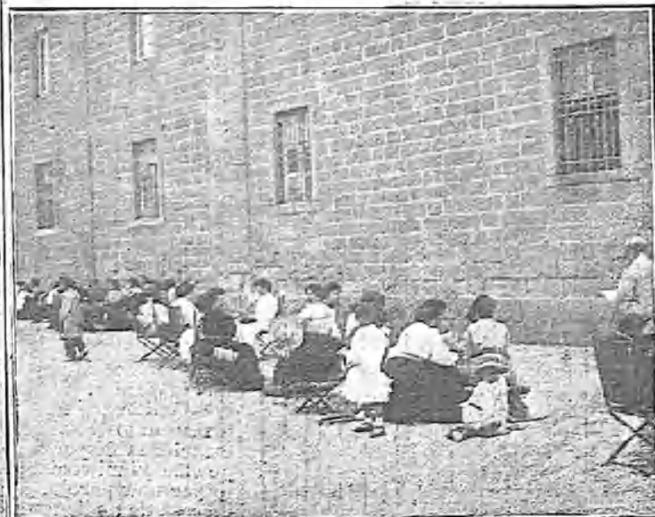
TERTULIA FEMENINA EN LA LONJA