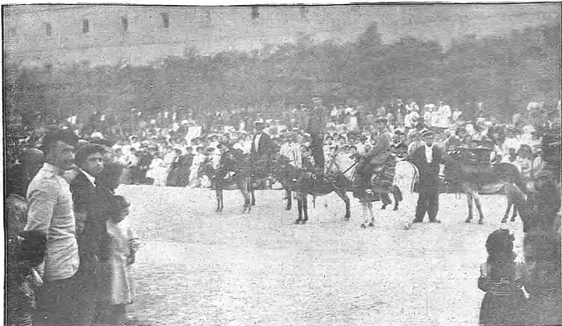
UNA FIESTA INFANTIL: LAS CARRERAS DE BURROS VERIFICADAS EN EL ESCORIAL

—Coge ese cesto. No quiero dejarte pescar.