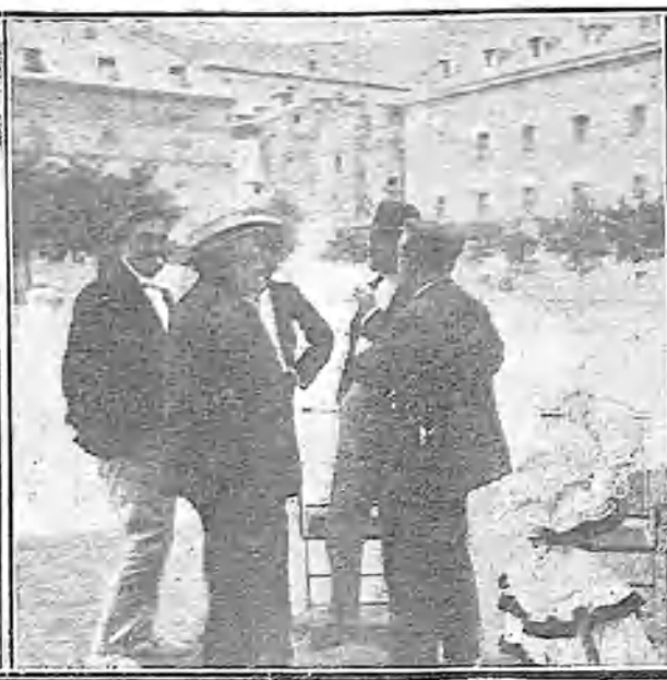
UN GRUPO DE HOMBRES SERIOS