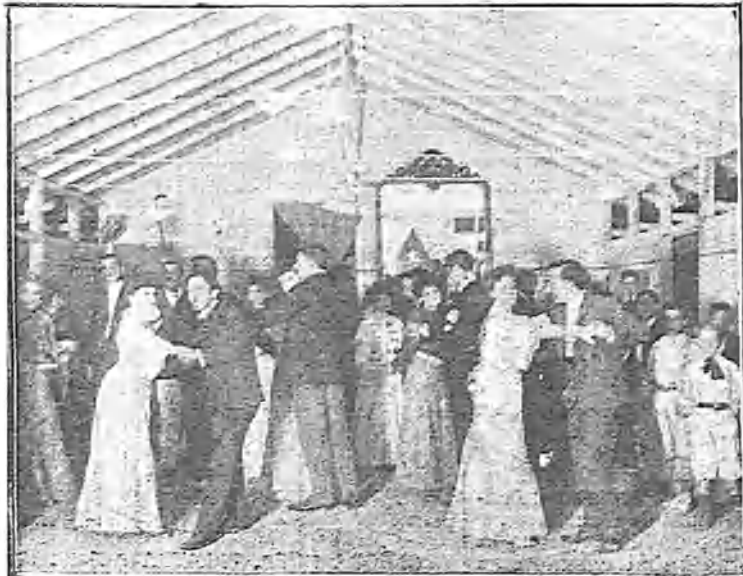
BAILE EN LA CASETA DE LOS TERREROS

Pelea tiene tanta popularidad en El Escorial, como en Madrid Gvilabli