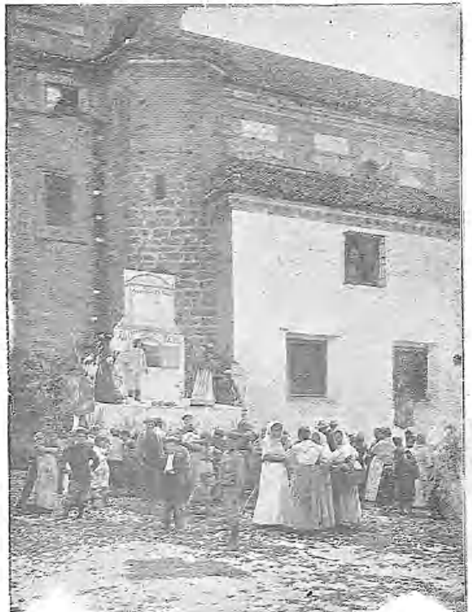
Los granadinos son apasionados del agua, y hacen de ello grande e inteligente consumo. Dias pasados el Ayuntamiento de la capital intentó privar de tan precioso liquido á los vecinos del Albaicín, quienes, para protestar, se congregaron en manifestación pacífica, y así los representa el grabado adjunto. Angel Canivet nos muestra las excelencias del agua granadina en el capítulo ¡Aguar de su Granada la Bella.