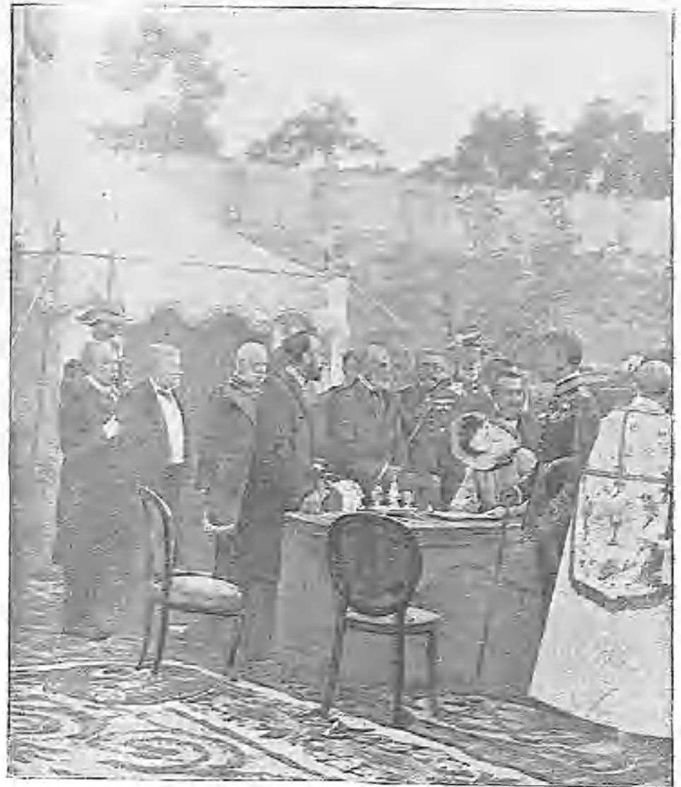
S. M. EL REY EN EL ACTO DE FIRMAR EL ACTA

tropezado en el problema del abastecimiento de aguas, ha sido el armonizar la variedad de gustos. En cualquier ciudad se hubiera puesto el asunto en manos de los químicos, para que éstos decidieran, después de concienzudos análisis, cuál agua era la mejor. Nosotros acudimos á los químicos, pero es para no hacerles caso; porque por encima de la ciencia están nuestros paladares, que en materia de aguas no reconocen rival en el globo. Sólo un gran poeta épico sería capaz de describir cómo sabemos beber agua, según ritos tradicionales, con los requisitos de un arte original y propio, desconocido de todos los pueblos.