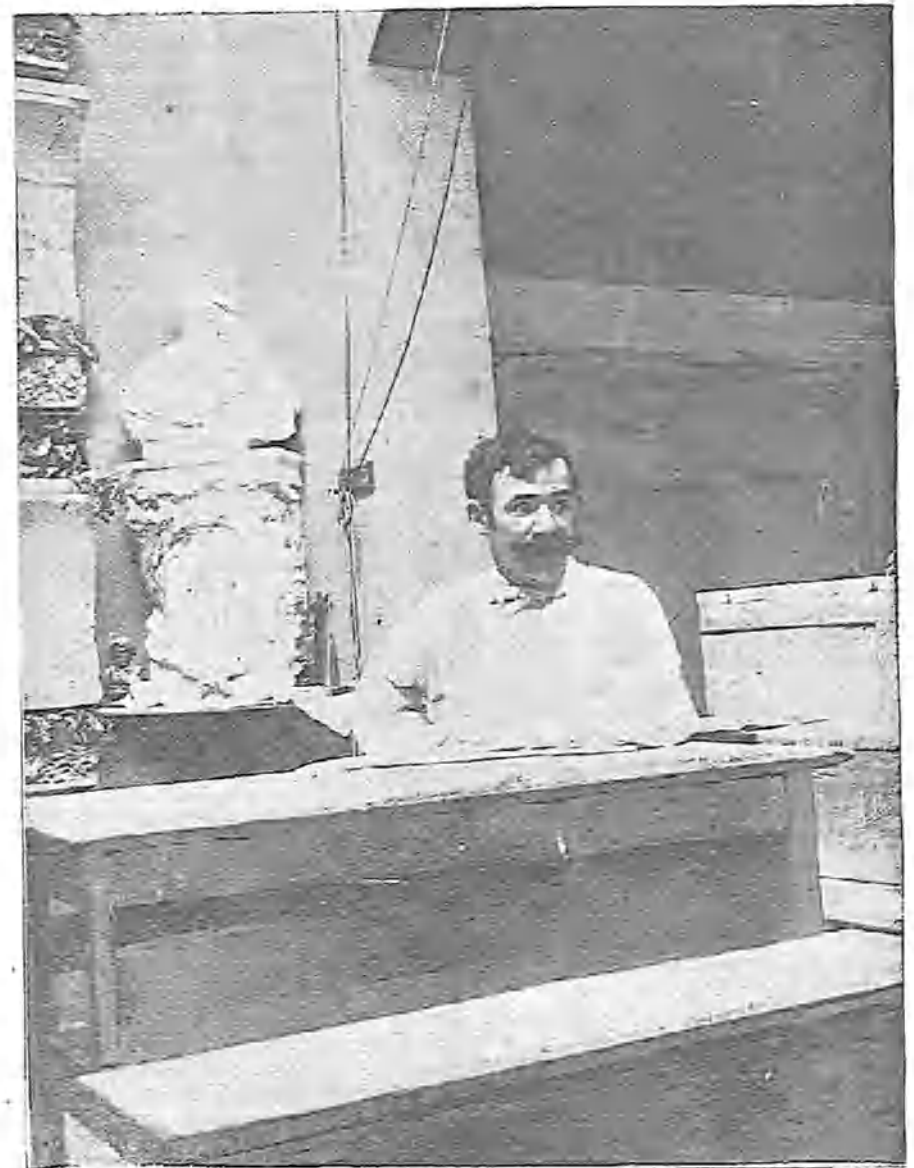
MARIANO BENLLIURE EN SU ESTUDIO

te, que nadie ve, por lo mismo que está á la vista de todos. Antes de crear un órgano nuevo conviene examinar si el que está prestando servicio no admite mejora, si el interés general exige realmente que se le sacrifique; porque en toda transformación hay un peligro: el