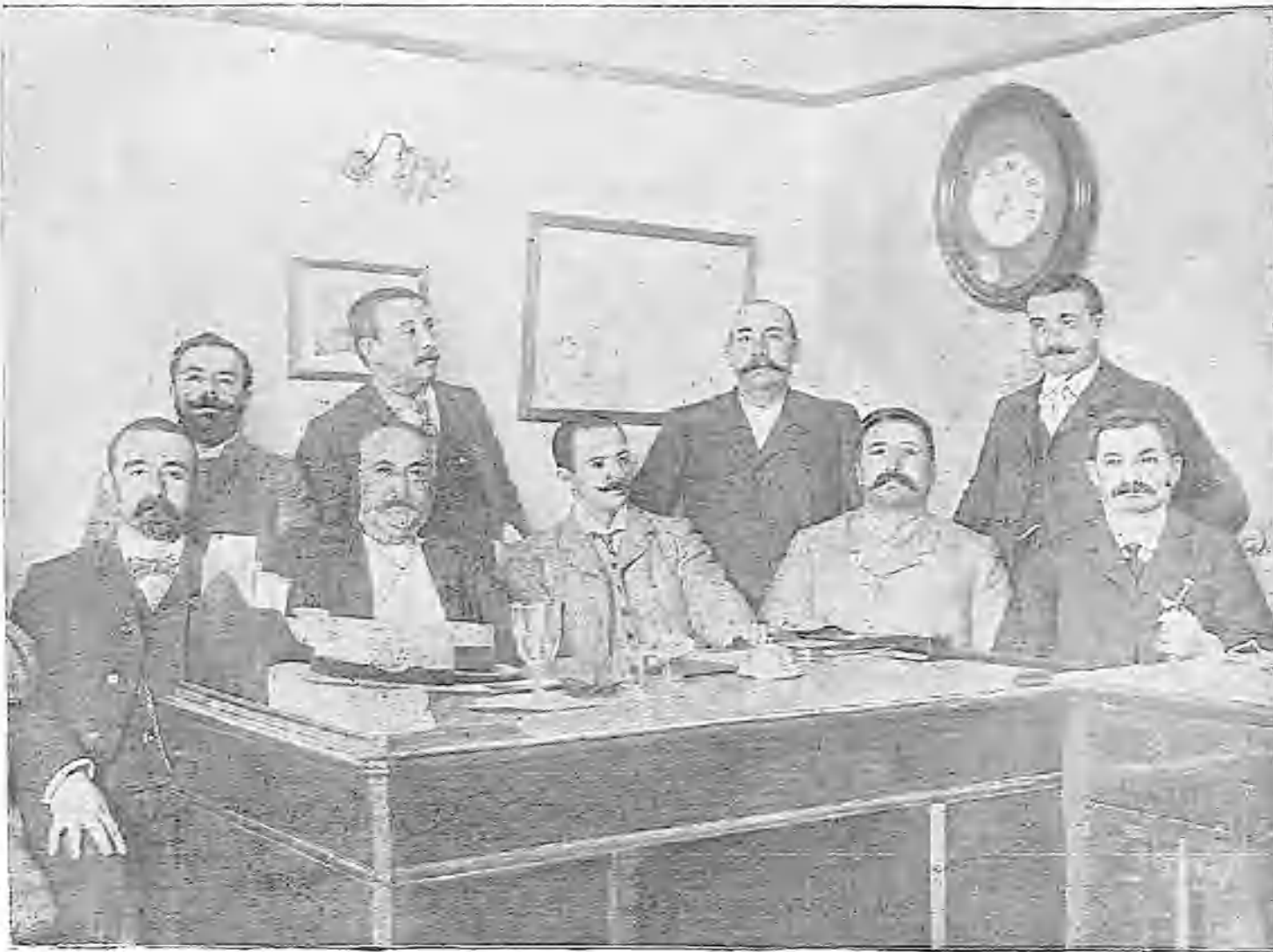
LA COMISIÓN PERMANENTE EN LA CÁMARA DE COMERCIO

diarios por cabeza, lo cual da una suma verdaderamente aterradora para una guerra continental que sólo dure cinco ó seis meses.