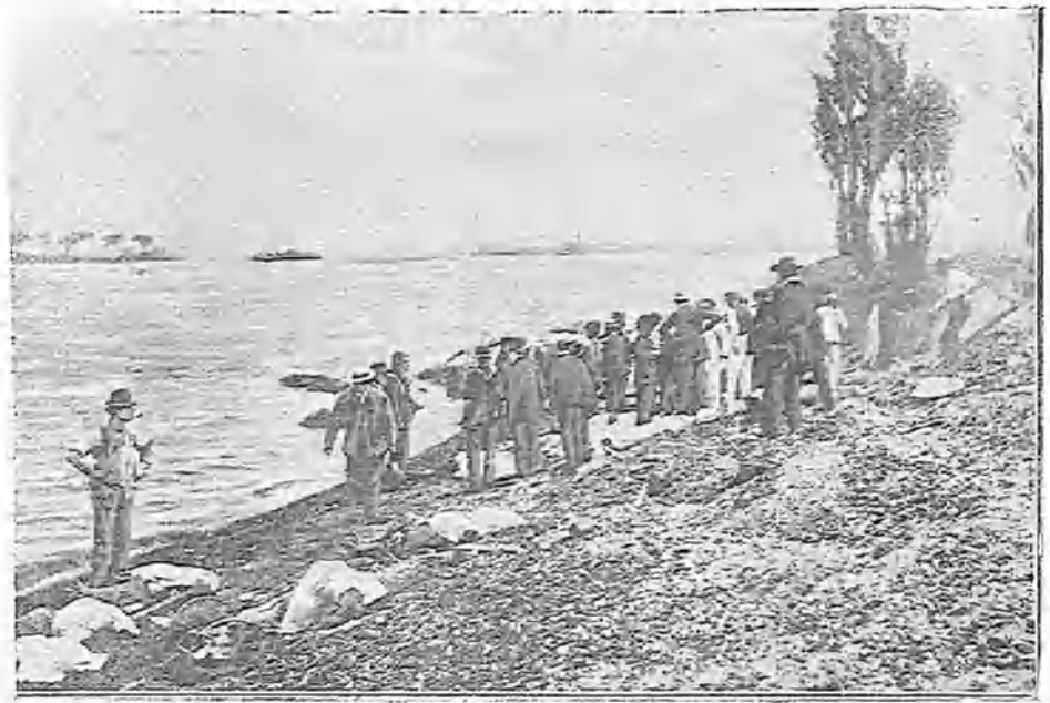
LOS CADÁVERES EN LA ORILLA DEL NORTH-BROTHER ISLAND