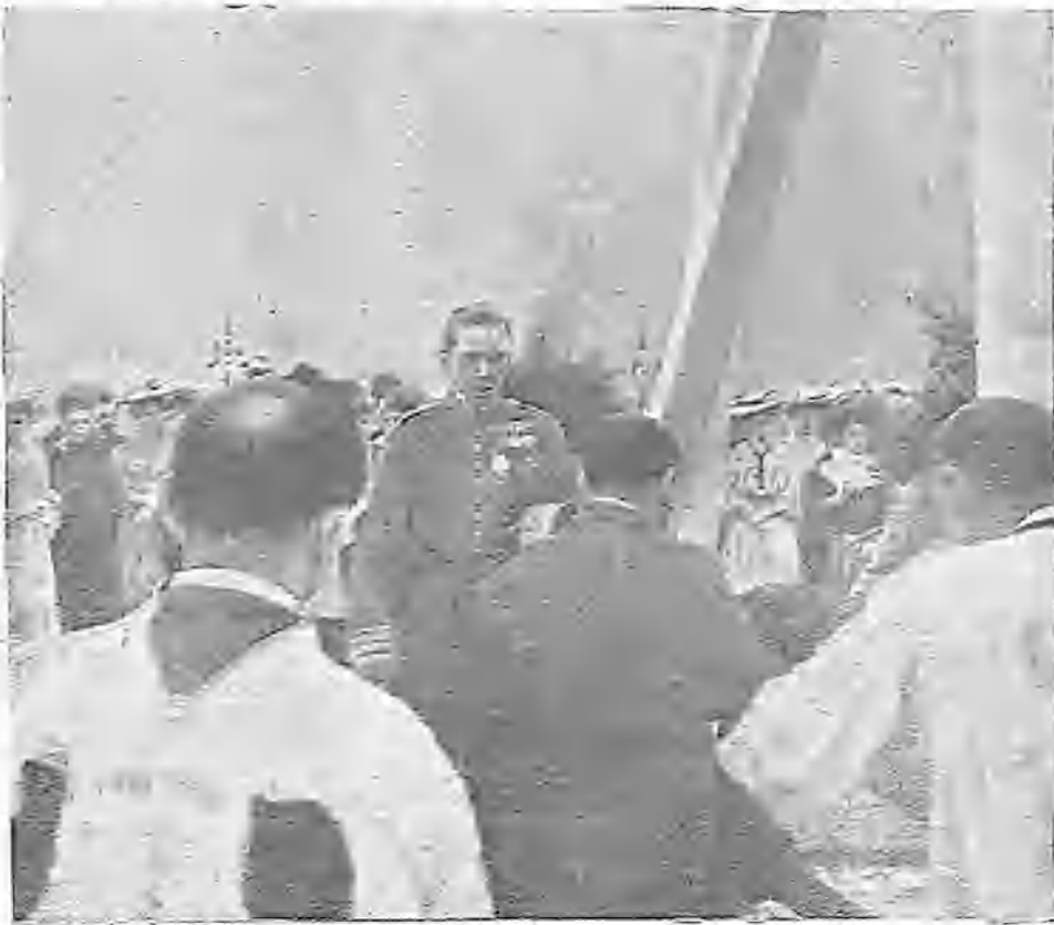
S. M. EL REY EN EL ACTO DE COLOCAR LA PRIMERA PIEDRA DE LA CASA DE SALUD DE SANTA CRISTINA, EL MARTES ÚLTIMO