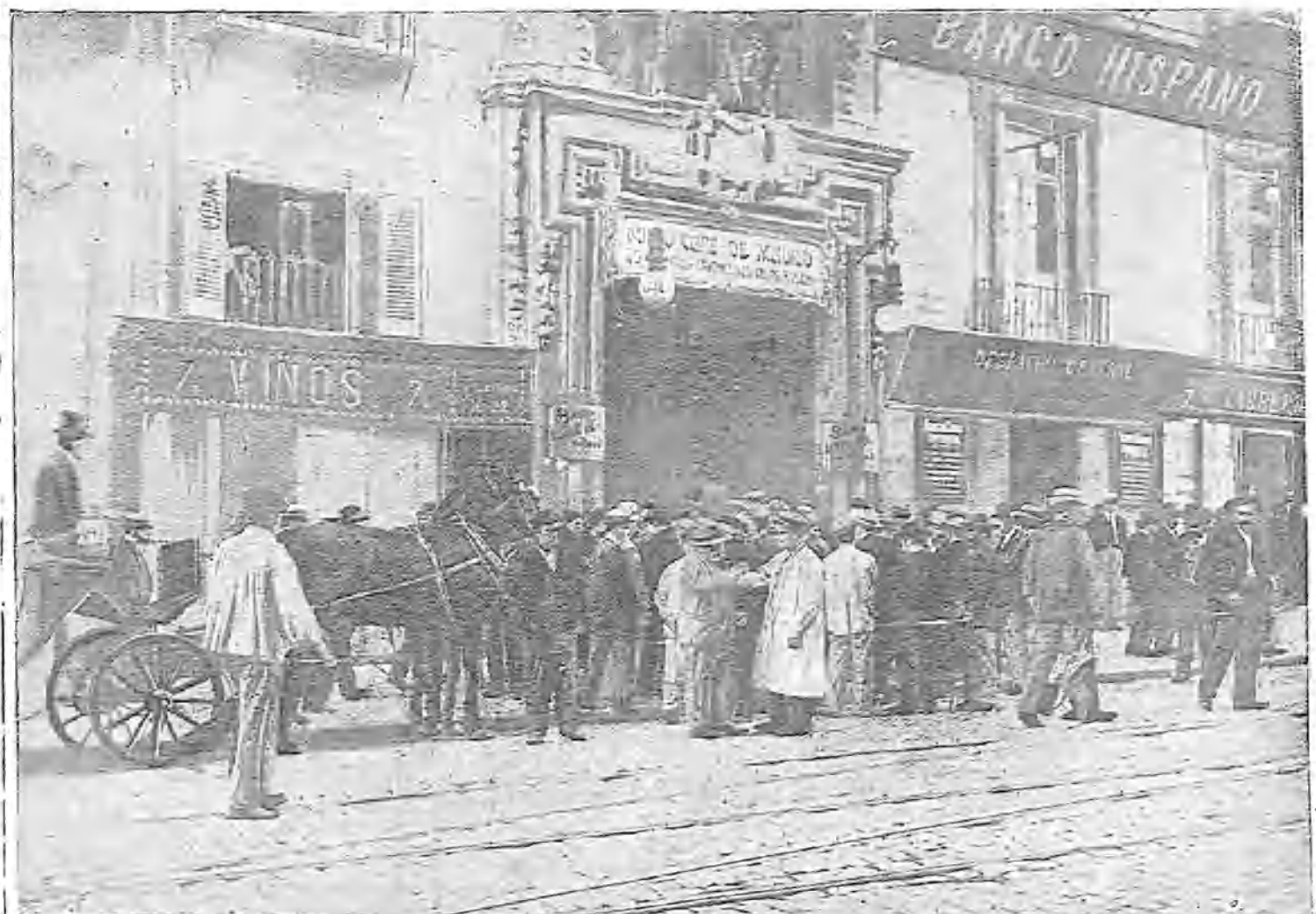
HUELGUISTAS Á LA PUERTA DE LA CÁMARA DE COMERCIO

Para evitar enojosas reclamaciones, debemos de advertir que no serán devueltos los originales que se nos envíen.