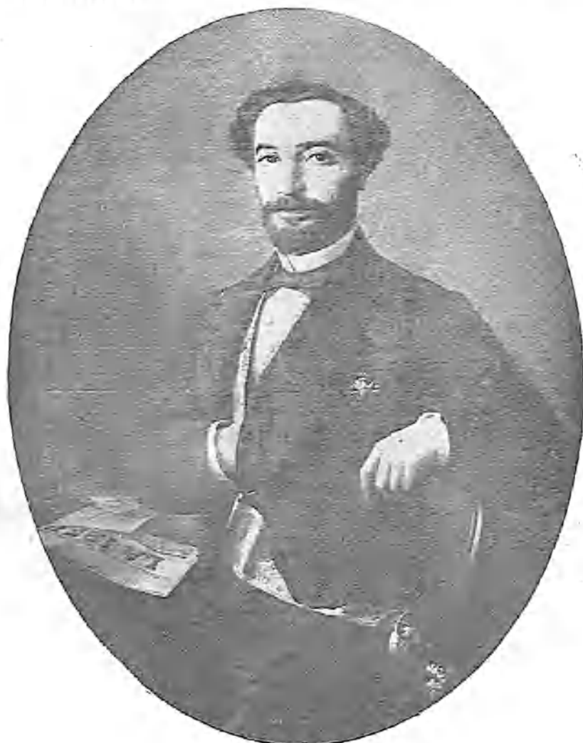
SAGASTA, DIRECTOR DE «LA IBERIA»

se comprándola á los aguadores. Procúrese generalizar más la costumbre; la cantidad que había de entregarse á una Empresa distribúyase entre las muchas gentes que viven de esa ocupación; en vez de crear tuberías nuevas refuércese y complétese esa tubería viva, semovien-