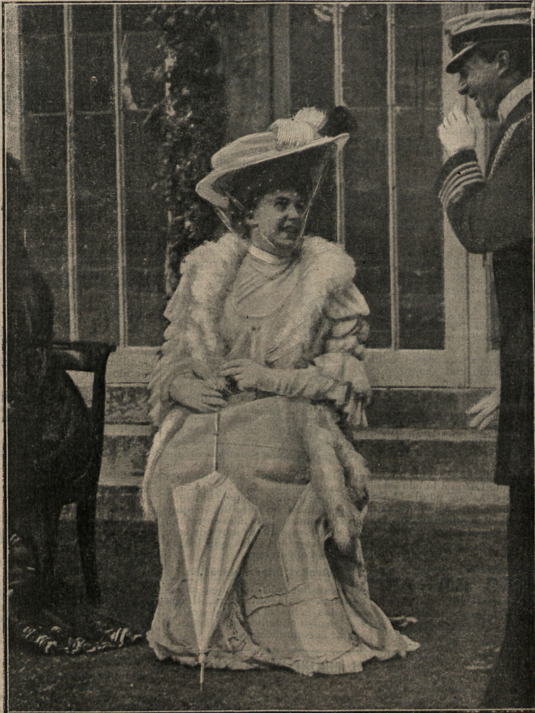
Princesa Ena de Battenberg.