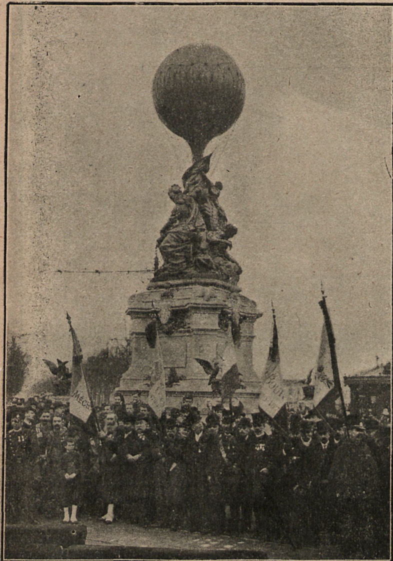
Inauguración del monumento erigido á la memoria de los aeronautas del sitio de París, verificada el día 27 en la capital de Francia.

Las supuestas nebulosas son nada más que sombras de montañas ó cordilleras.