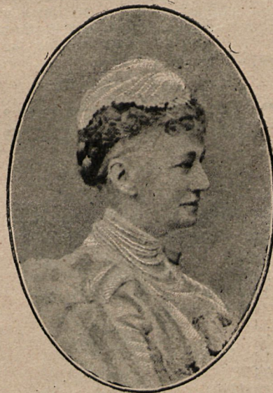
La reina Luisa Guillermina de Dinamarca, viuda de Cristián IX.