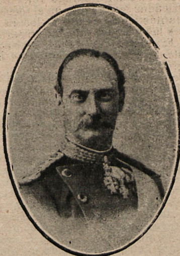
El nuevo rey de Dinamarca Federico Guillermo.