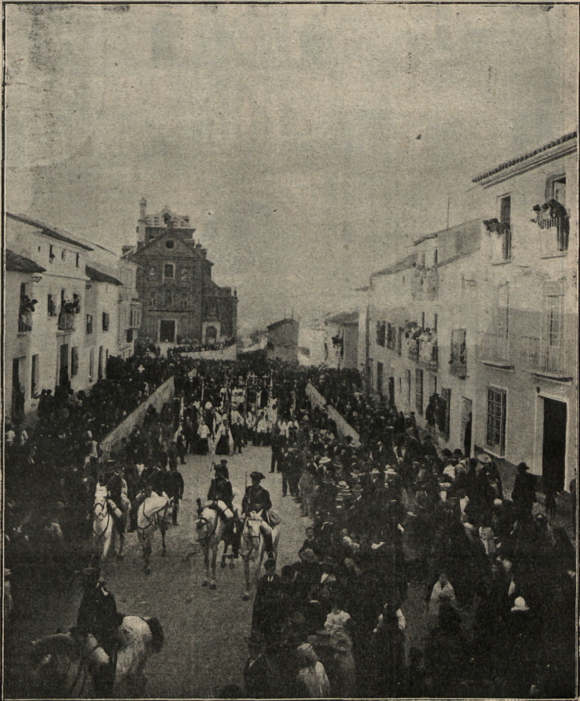
La comitiva fúnebre dirigiéndose á las Casas Consistoriales, donde se instaló la capilla ardiente.

en el extranjero, con el encargo de que contesten á su majestad imperial con otras ilustradas.