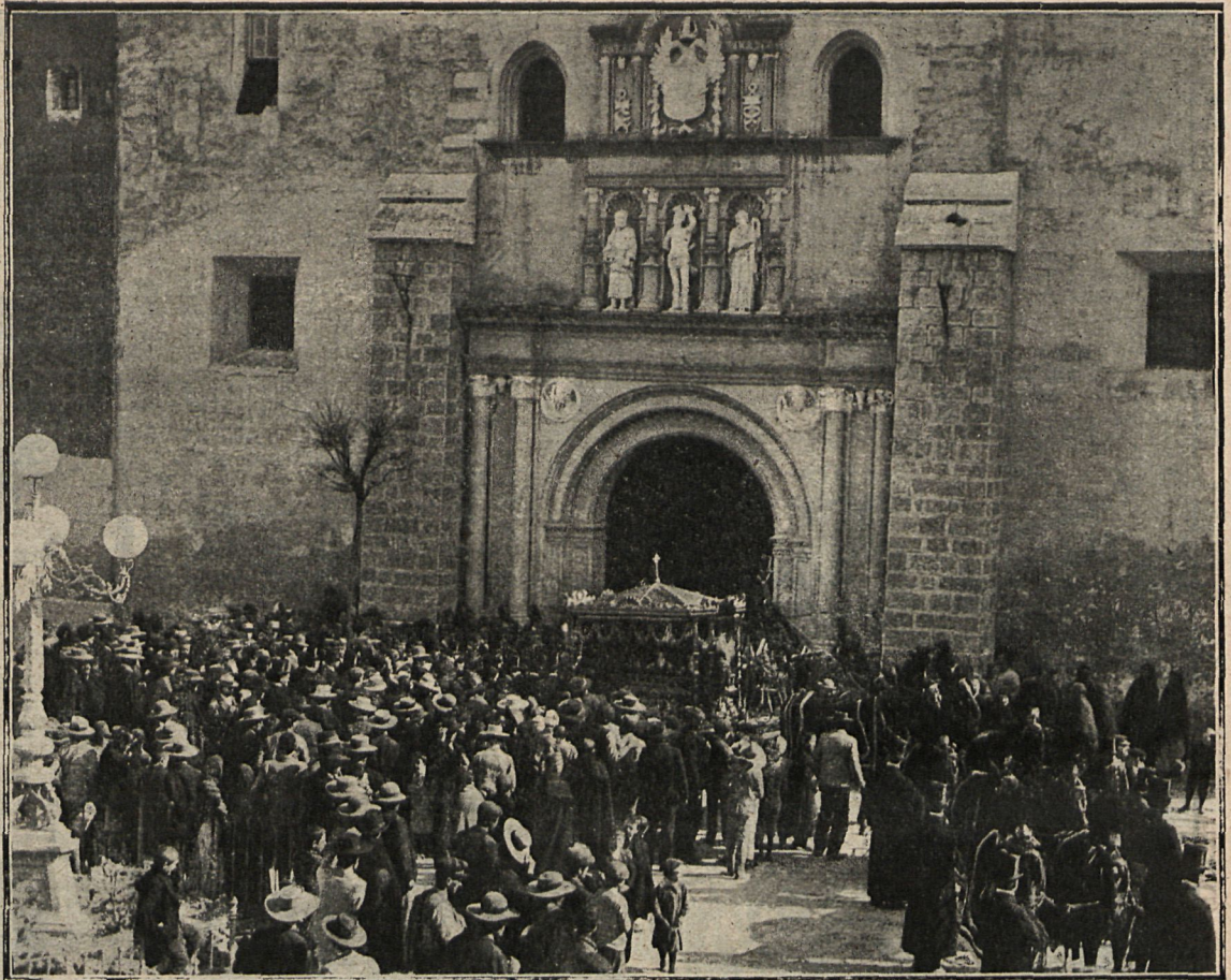
Llegada de la comitiva á la Iglesia Mayor.