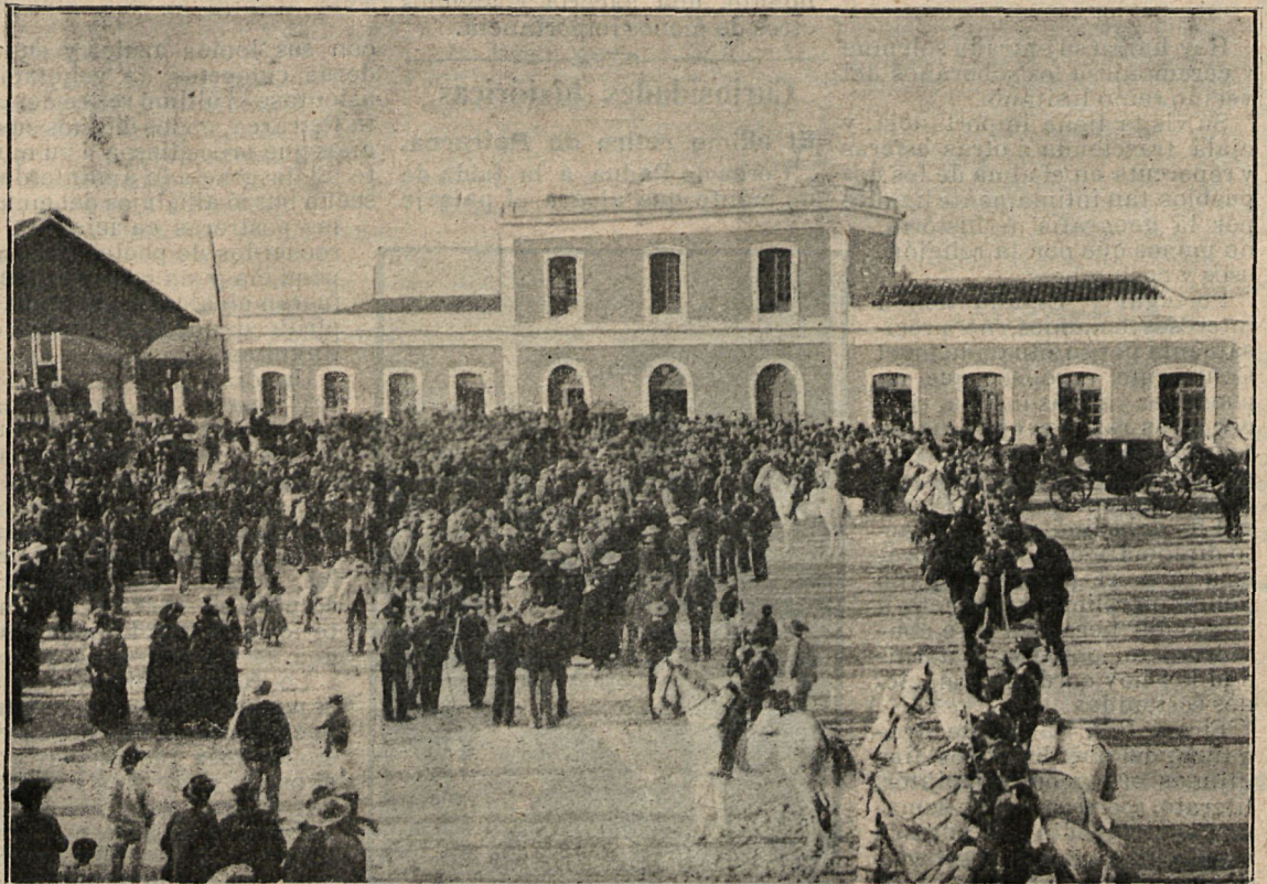
Llegada de la comitiva á la estación de Antequera.