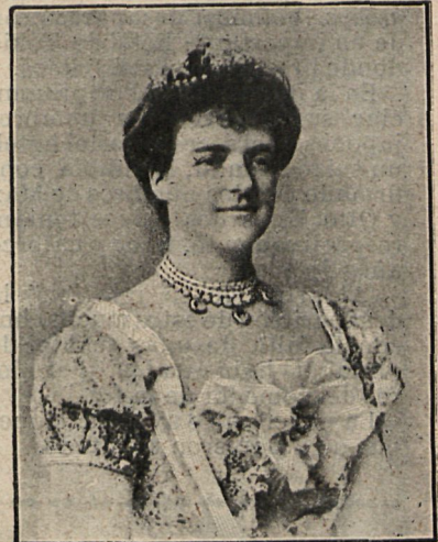
S. M. la Reina Amelia.

biéndose á iniciativas suyas el que hoy esté saneada la moneda lusitana y equipare á los francos para los efectos del cambio.