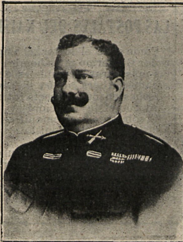
S. M. el Rey D. Carlos.