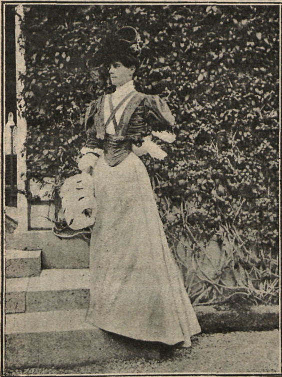
Traje de paseo, compuesto de chaqueta de terciopelo obscuro y falda de cachemir en tono claro.