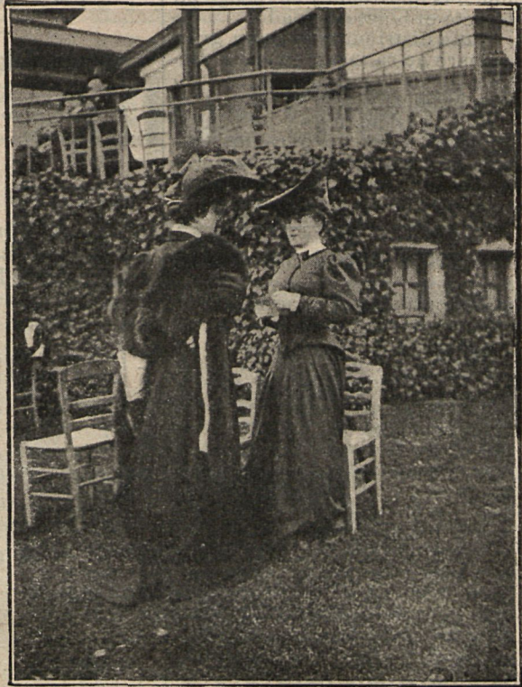
Trajes de paño, de levita y de cuerpo corto, hechura sastre, negro y gris bronce.