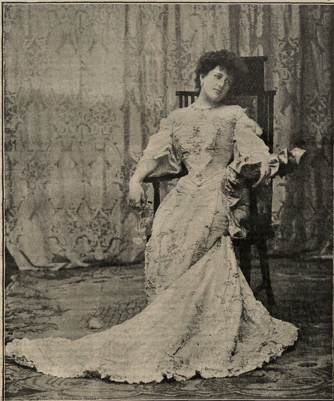
La eminente actriz italiana Tina di Lorenzo, que hará su debut en breve en el teatro de la Comedia.