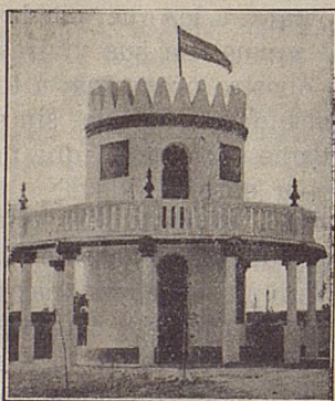
COLONIA MONTE CARMELO Plaza de la Victoria.—EL TORREON

Barquillo, 32, y Fernando VI, 14.-Teléfono 34.265.-MADRID