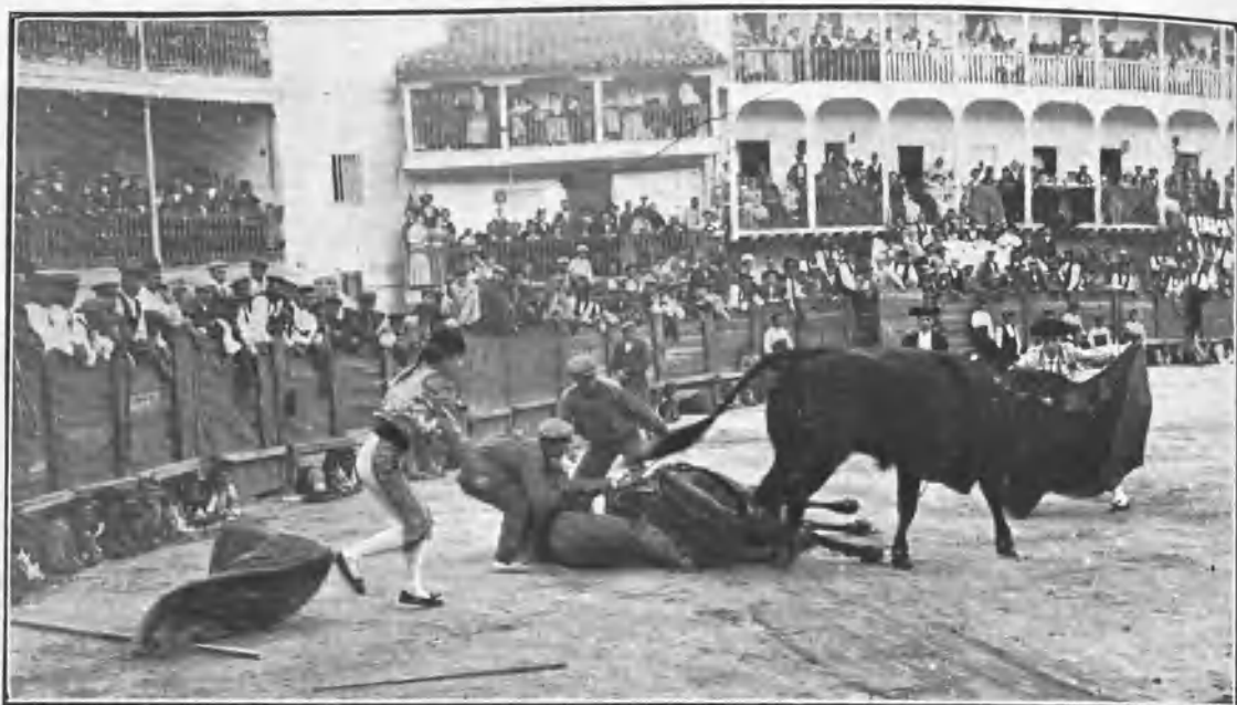
UNA CAÍDA Y CORCITO AL QUITE

En el pueblo de Chinchón, en el que se guardan como reliquias algunos recuerdos del inmortal Frascuelo , dan todos los años una ó dos corridas modestas, y á la del último domingo le dieron carácter de corrida mixta por figurar como espadas uno de toros y otro de novillos.