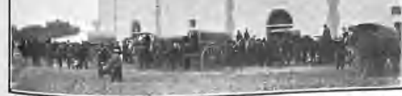
EL PÚBLICO SALIENDO DE LA PLAZA DE MANZANARES

El final de esas jornadas taurinas es indefectiblemente el monte ó la ruleta, de donde los expedicionarios salen mustios creyendo oír constantemente el invariable... No va más, señores.