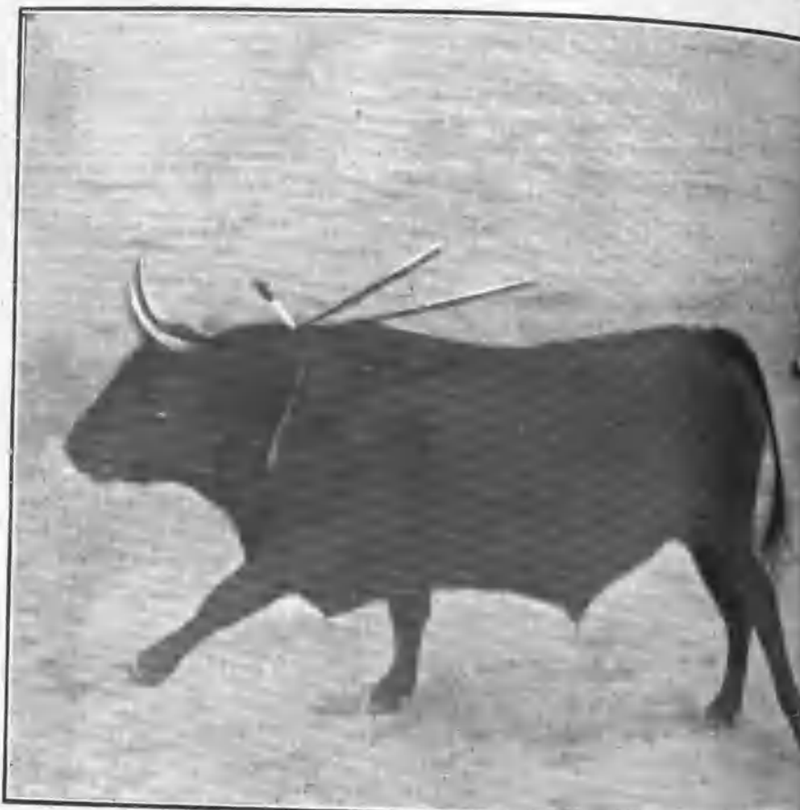
REGATERÍN DESPUÉS DE LA ENTRA A SU PRIMERO