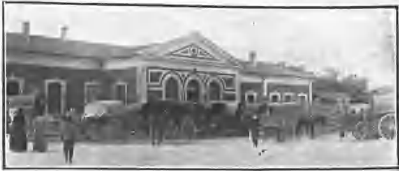
GALERÍAS Y GALERONES ESPERANDO VIAJEROS

El inolvidable Pascual Millán en su hermoso libro Cárteles de oro no dice nada de los toros de la Mancha, y realmente, dado el carácter de la obra, nada podía decir, pues que no hay rasgos salientes en la historia de la provincia de Ciudad Real que se puedan relacionar con la fiesta taurina. Pero ya que no merecen las corridas manuegas hacer de ellas un estudio histórico, si merecen que se diga algo de su carácter típico, de sus preliminares y de otros puntos relacionados con ellas.