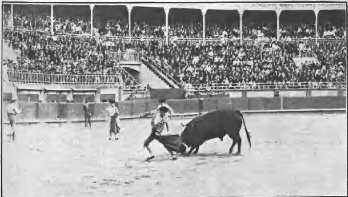
REGATERÍN REMATANDO UN QUITE