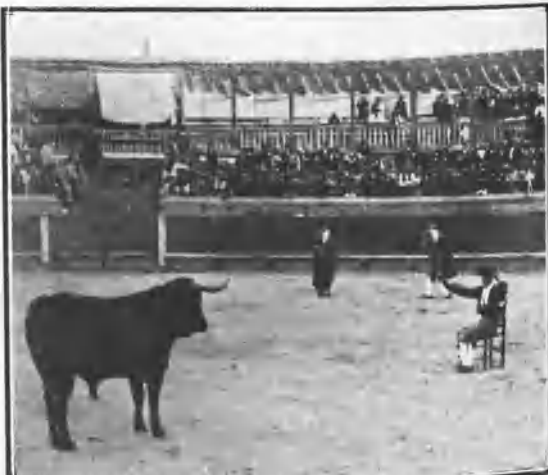
TETUÁN PATOLAS PONIENDO BANDERILLAS EN SILLA