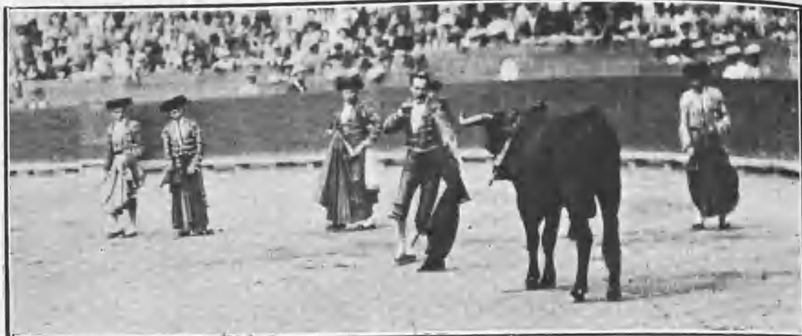
VALENCIA. TORTERO ENTRANDO Á MATAR Á SU SECUNDO TORO