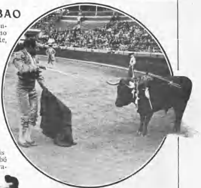
QUINITO ENTRANDO Á MATAR

Entre los cinco toros de Surga tomaron 21 varas, á cambio de 12 caídas y seis caballos en plaza, amén de cuatro ó cinco más que fueron apuntillados en las cuadras, y de cuatro refilonazos de salida.