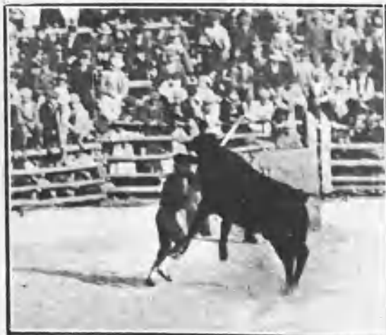
VALLECAS. ALMENDRO Á LA SALIDA DE UN PAR

La fiesta ha debido de producir buenos rendimientos.