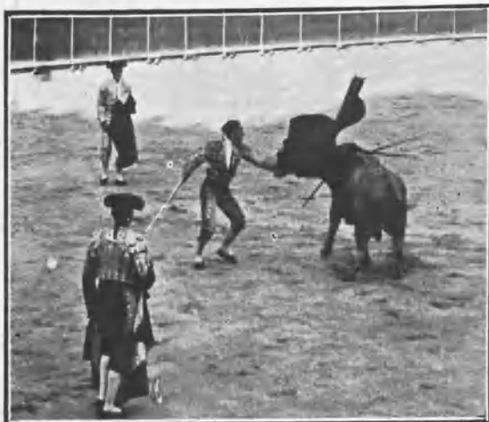
GALLITO CHICO PASANDO DE MULETA