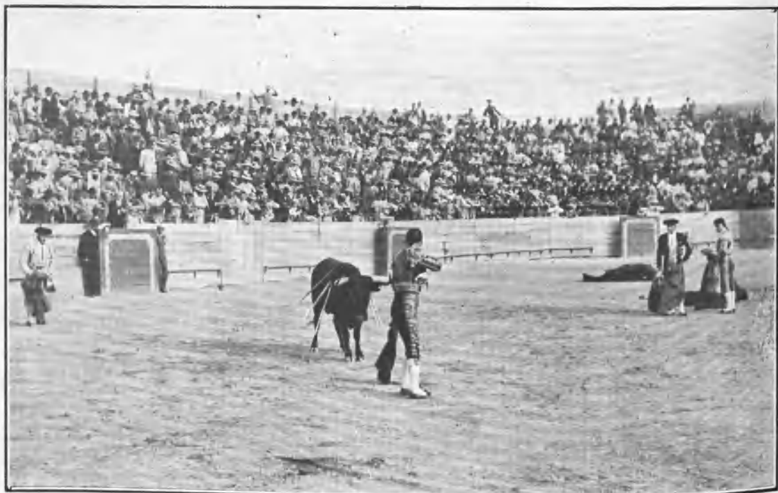
RERRE ENTRANDO Á MATAR Á SU PRIMER TORO

Lo mismo les deseamos para todas las corridas que les queden por torear.