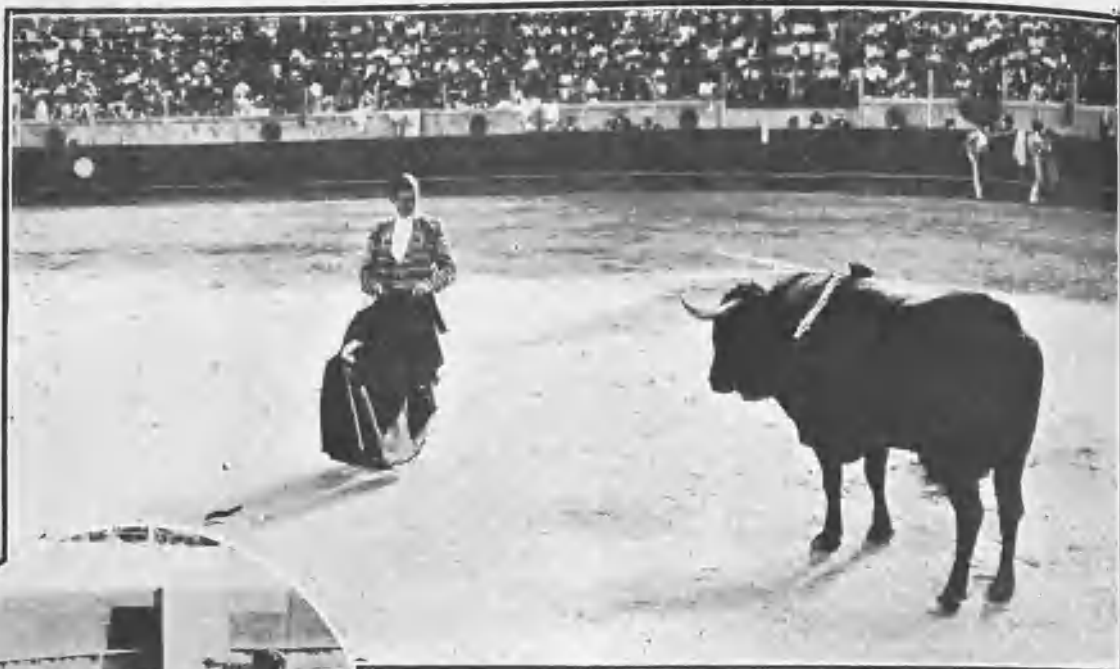
BOMBITA EN EL PRIMER PASE