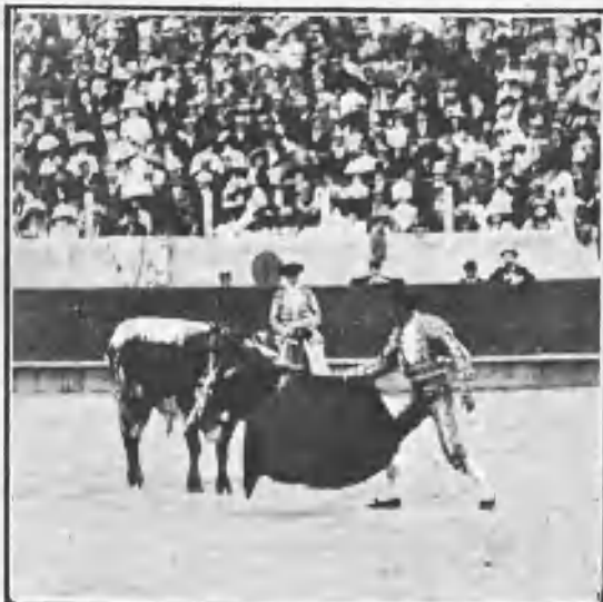
COCHERITO PASANDO DE MULETA AL SEXTO TOPO