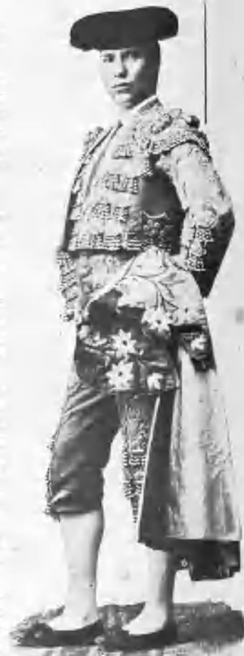
ELIGIO HERNÁNDEZ (EL SERIO)