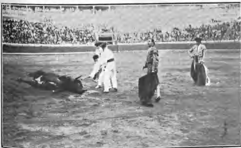
GUERRERITO DESPUÉS DE UNA ESTOCADA

Los palcos estuvieron vacíos, y esto produjo comentarios nada favorables para cierto público que no ha tenido en cuenta el objeto benéfico de la fiesta.