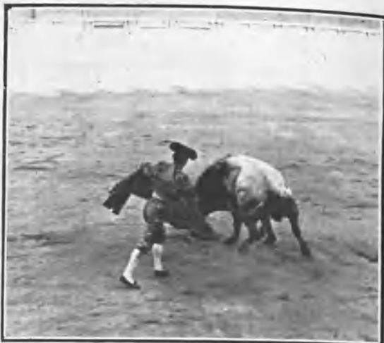
PUNTERET TOREANDO DE CAPA