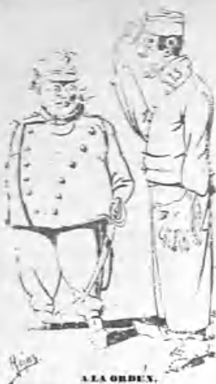
A LA ORDEN.

—No hay novedad, mi coronel. —¿No hay novedad y tu coronel está con un dolor de muelas que rabía?