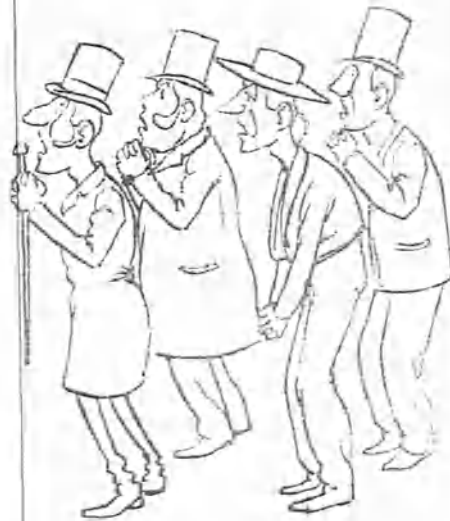
—Dios mío ¡que se la corta, que se la corta!