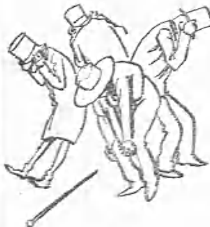
—¡Se la corta!

meterme en honduras químico-afec- tivas, como aquellas de la cristaliza- ción , que tan magistralmente trató el autor de La Cartuja de Parma y Rojo y Negro .