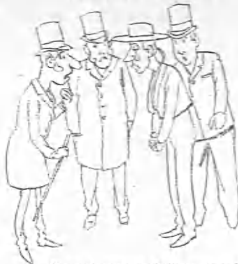
—Y gustad cree que efectivamente se la corta?

Y mucho menos, dejando á un lado la vidriería sentimental, he de