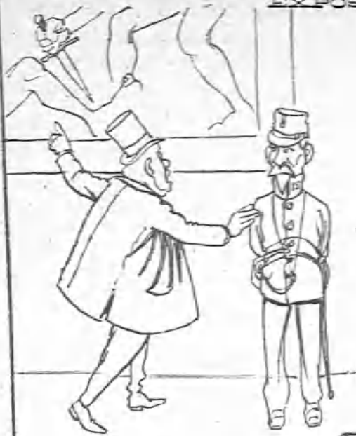
—Guardia, guardia. que matan á ese hombre!