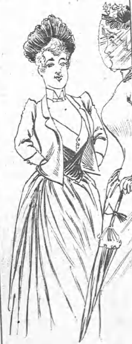
—Cuando pase alguien por delante del cuadro en que estoy de Vénus dí que estoy muy parecida. Es una manera de hacer propaganda.

mente de aquel aplomo y suficiencia que aquí conducen á los mayores éxitos; rebotaría en aquella satisfacción exterior harlo más recomendable y productiva que la interior satisfacción de que habla la Ordenanza; y causaría, en fin, entre las mujeres de buen tono «inmensa sensación», como dicen los noticieros.