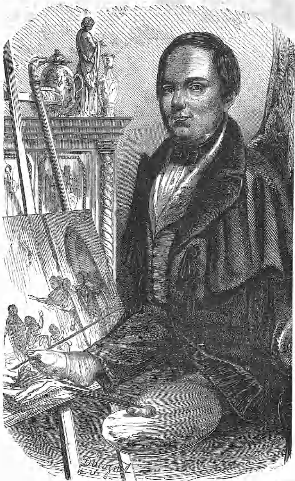
(El pintor Ducornet.)