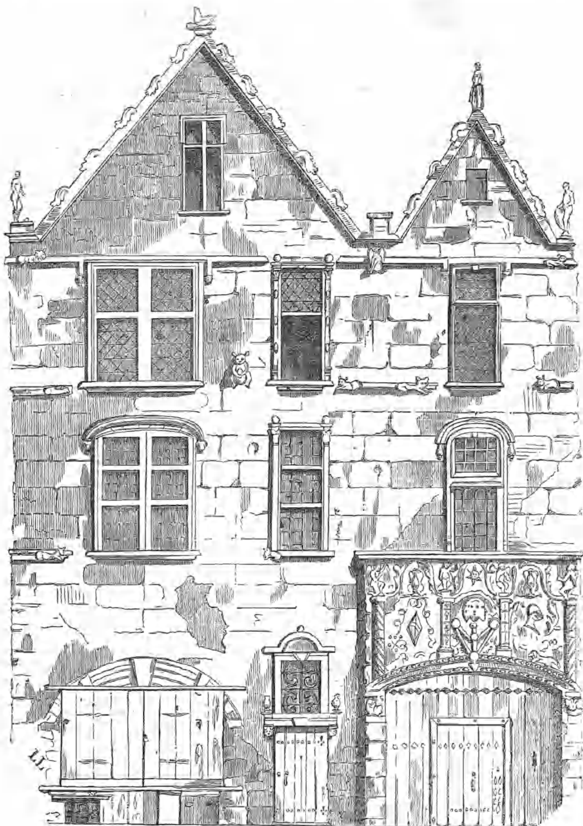
CASA DEL ALQUIMISTA ESPAGNET, EN BURDEOS.

En el número de los filósofos herméticos mas distinguidos que florecieron á fines del siglo XVI, merece ser citado Juan de Espagnet, presidente del parlamento de Burdeos. Sus estudios profundos en la parte misteriosa de la química que tiene por objeto descubrir la transmutacion de los metales y la piedra filosofal, han salvado su nombre del olvido. Es de sentir que con tan vasta erudicion, y conociendo la fuerza mejor que ningun hombre de su época, su loca creencia en la