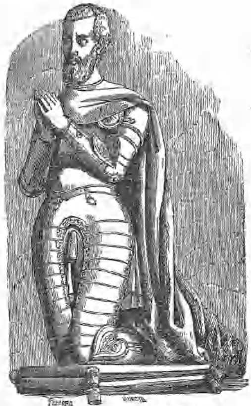
Estatua de Garcilaso de la Vega.