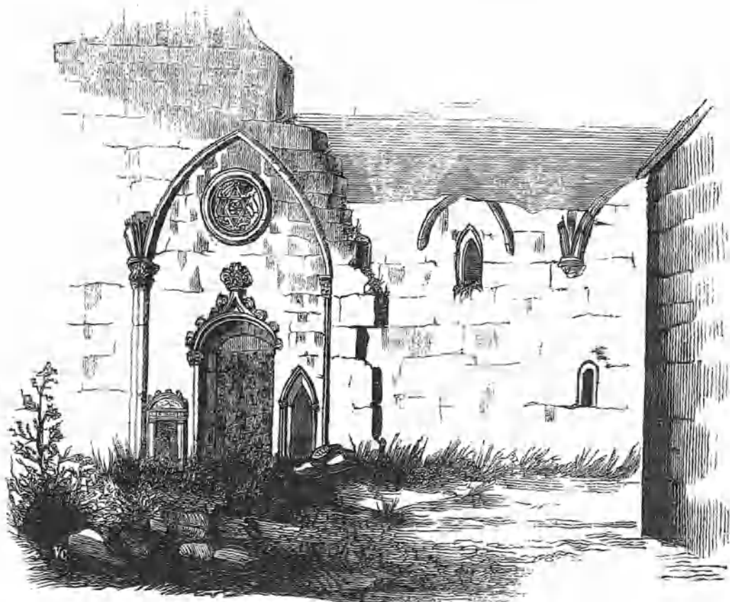
EL CONVENTO ANTIGUO DE SAN FRANCISCO DE BURGOS.

L EGARA tiempo en que abjurando algunos hombres los principios que ahora reputan por filosóficos y sábios, volverán la vista hácia la era de nuestros abuelos y se reconciliarán con su fé y con sus creencias. Entoces sentirán el inmenso estrago que las disensiones intestinas han producido en nuestra patria, mimada por la naturaleza y cuna clásica de caballeridad y de honor. Entoces verán á la luz de la historia, fanal resplandeciente de los siglos, ciudades enteras arruinadas, templos reducidos á escombros, sepulcros desmoronados y fúnebres inscripciones góticas inerustadas en la casa del rico, al lado de las piedras ojivales, de los emblemas santos y de los es-