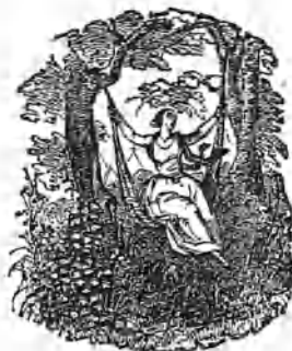
LA SOCIEDAD MODERNA.

ros en la calidad de la tierra, lo mismo que otras prácticas rurales que debian abandonarse. Las tierras son lo que se quieren que sean: abono, buenos arados y brazos fecundizan las mas estériles. En el dia hasta al arado se ha aplicado la fuerza motriz del vapor.