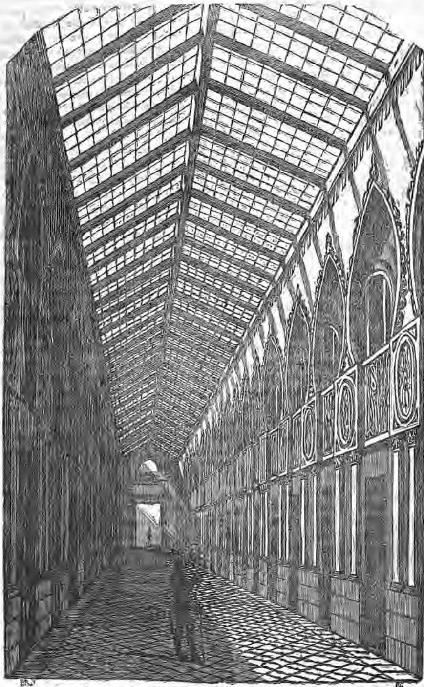
GALERÍA CUBIERTA, Y MERCADO DE S. FELIPE NERI.