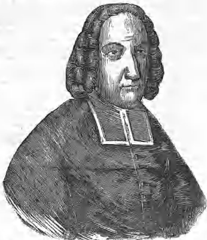
EL CARDENAL ALBERONI.

La nación española encierra en su seno tales elementos de prosperidad, que aun despues de las guerras mas desastrosas y de las mayores calamidades, si se ha puesto al frente de ella un hombre de genio, ó se ha mejorado de algun modo su administracion interior, no ha tardado en recuperarse de sus pérdidas, volviendo á colocarse en el puesto que le corresponde entre las naciones civilizadas, y asombrando al mundo con hechos grandes y portentosos. Esto fue lo que le sucedió despues de la guerra de sucesion, en que no le faltó mas que lo que en otras muchas ocasiones le sobra, es decir, paciencia y calma en la ejecucion de sus proyectos, para producir una gran revolucion en el sistema político de Europa. Debíó este impulso al cardenal Alberoni , gran ministro, que si no ha dejado una fama igual á la del cardenal Cisneros , es porque le favoreció menos la fortuna, siendo seguida su corta elevacion de una caída estrepitosa.