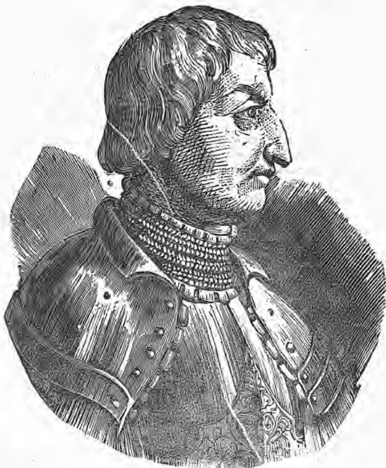
DON ALONSO V.º DE ARAGON.

D on Alonso V fue uno de los reyes mas grandes que ilustraron á Aragon. Era hijo de D. Fernando el Honesto, infante de Castilla, y elevado á aquel trono por la junta de compromisarios que se reunió en Caspe para elegir entre los varios competidores que aspiraban á la sucesion del rey D. Martin el Ceremonioso. D. Alonso, pues, y sus hermanos habian nacido en Castilla; y como estos tenian en ella cuantiosos bienes y elevadas dignidades, no contribuyeron poco á las continuas revueltas que agitaron el turbulento reinado de D. Juan II.