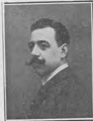
D. Julio Pellicer, autor.

Es Carmen. Enriqueta, indiferente y dulce, se consuela riendo. Soñadora y pensativa, Luisa intenta ocultar la impresión que le ha producido la noticia... Y, como dirían los otros , algún personaje de los clásicos lope-silveanos , ya s'armao la obesa , es decir, apunta el conflicto: dos hermanas, igualmente adorables y que se quieren de