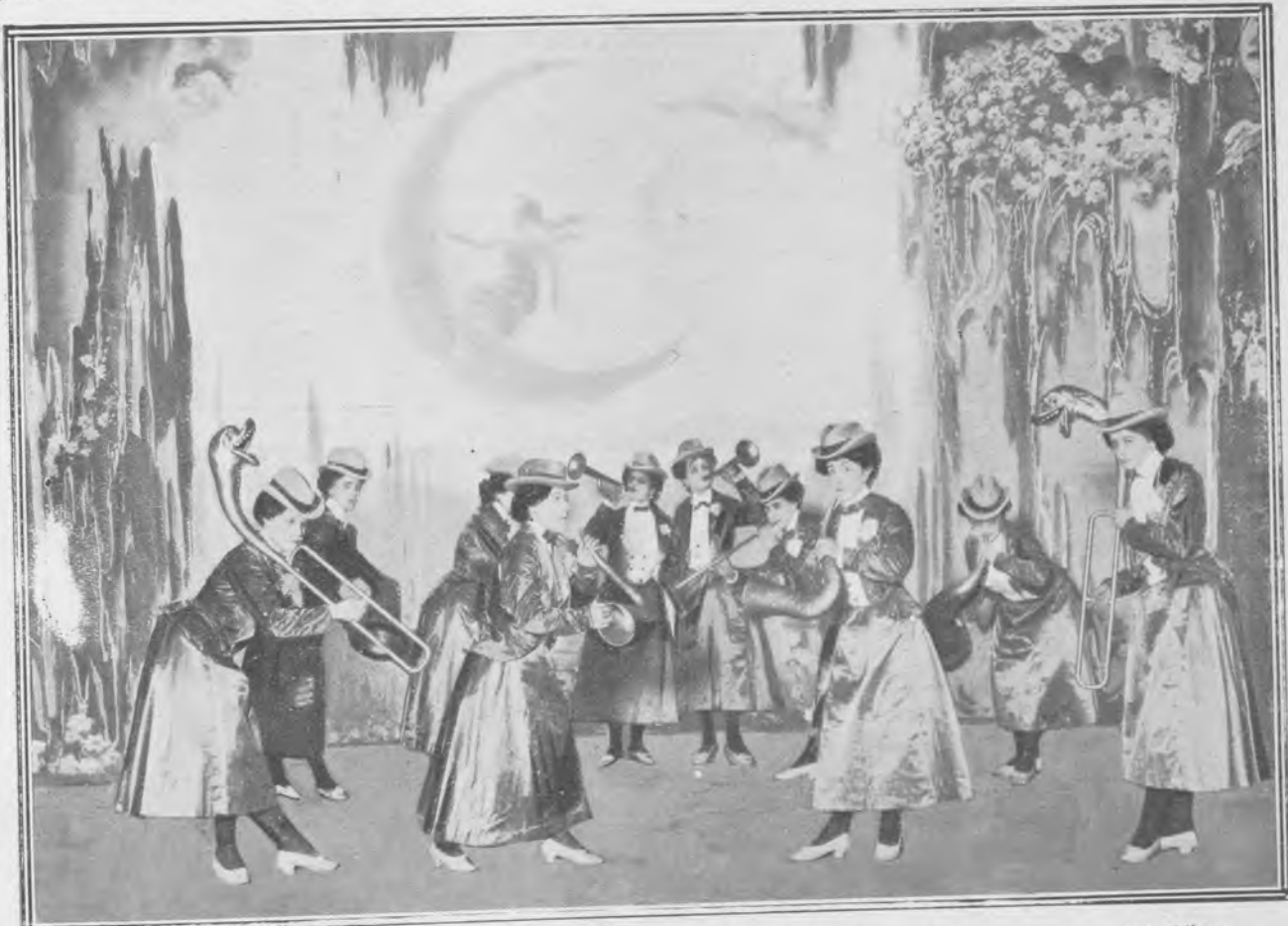
La alegre trompetería. — Escena final de la obra.