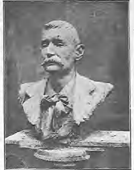
Busto de Pérez Galdós.

»Viniendo á otro orden de consideraciones más prosaicas, te diré que he recibido la pensión mensual ciento veintitrés liras : he aquí á lo que quedan reducidas las doscientas cincuenta pesetas. Creí tranquilizar mi ánimo al salir de esa desventurada tierra y al llegar aquí sufre la humillación de ver á los yanquis con sus sombreros flamantes y sus botas charoladas, disfrutando pensiones de dos mil reales mensuales y por diez años.