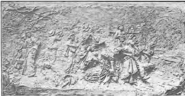
Una mona, bajo relieve.

Parece que á distancia del tiempo se debilita la [indulgencia que