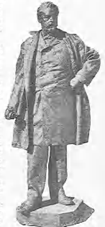
Estatua de Maisonnave, en Alicante.

no me atrevo á decirlo en rigor de verdad; pero ahí vá un párrafo de su última carta de Roma, que nos ha dejado absortos á los que conocemos el excesivo «castelarismo» de su modo de juzgar á los del oficio. El cofrade que ha caído en la presente ocasión es Miguel Angel. Perdone el chico de las de Buonarroti.