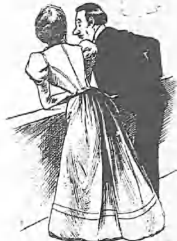
Haré siempre este papel de despreciarte, Toló ó has de comprarme un reloj de la casa de Coppel.

El número Almanaque , que modestia aparte, será una preciosidad, no se servirá á ningun corresponsal moroso.