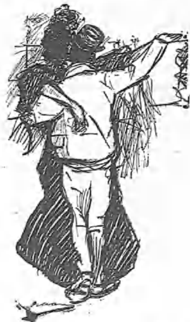
Modelo de choubersky que se recomienda por sí solo.