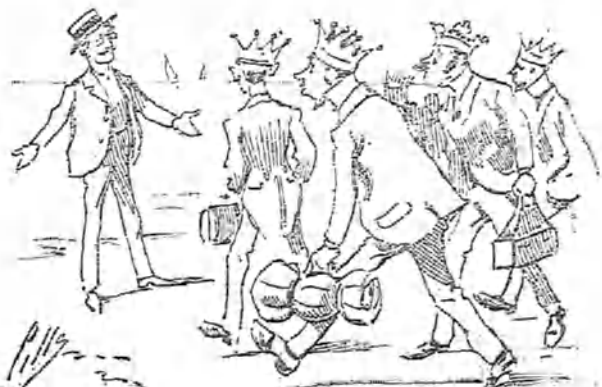
¿Por qué? Porque los nobles, los potentados, los reyes, los grandes de la tierra se han ido todos a Espiño arrastrados por Taboada... ¡Ah, infame!