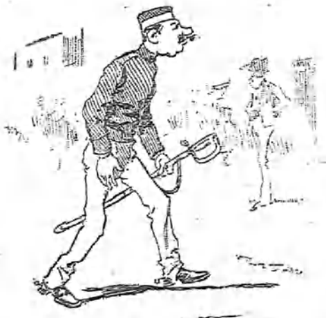
¡Oh misterios de la organización militar de las grandes potencias! Los soldados de caballería llevan pantalón largo.