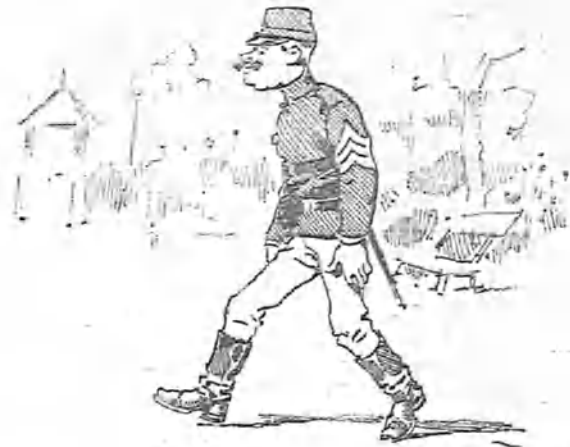
Y los de infantería botas de montar.