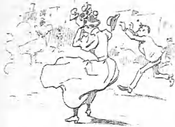
El vendaval siempre violento y ¡ay! demasiado frecuente.