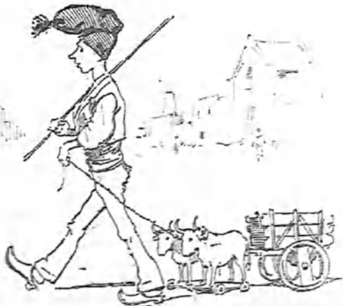
Aquí son los carros muy chiquititos y los gorrros muy grandes.