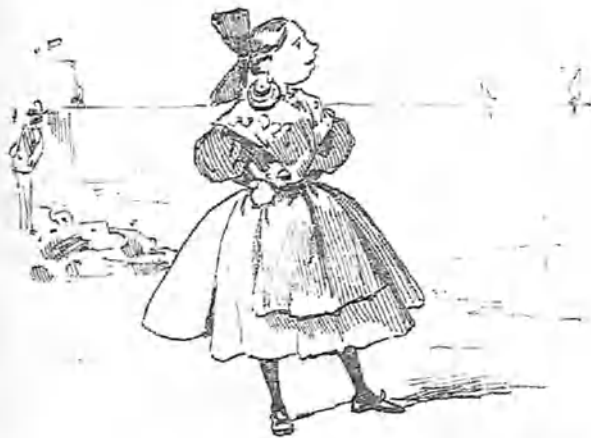
La colonia extremeña muy característica y muy dignamente representada.