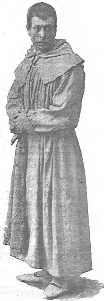
— Yo tengo que estudiar la topografía del terreno. ¿Hacia dónde caerá la bodega?