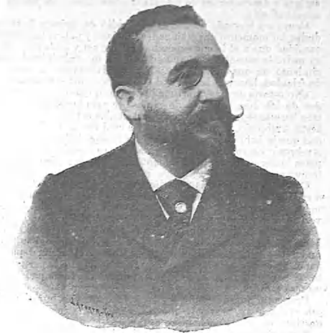
D. Ruperto Chapi. AUTOR DE LA MÚSICA