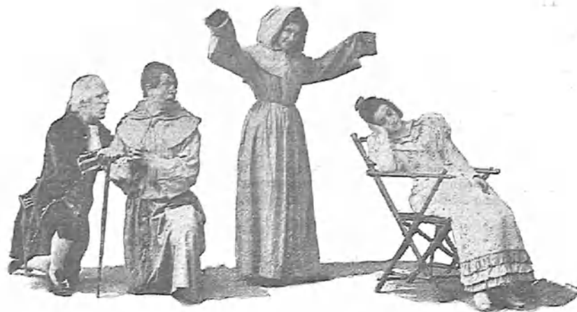
D. Emilio Sánchez Pastor. AUTOR DEL LIBRO

— Dominus vobiscum. Contesten á dúo: — Espiritu tuo, — Per semper. — ¡Amén