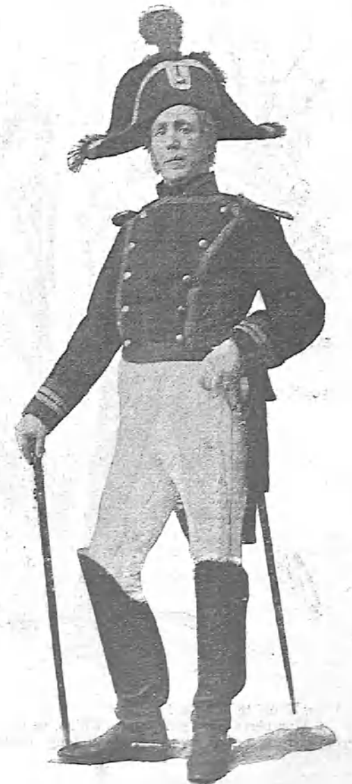
— Mi mayor placer sería fusilar media docena de frailes.