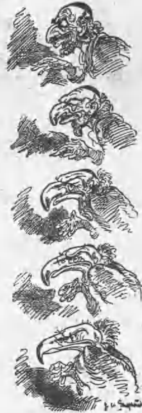
Dib. de Moonch nr.